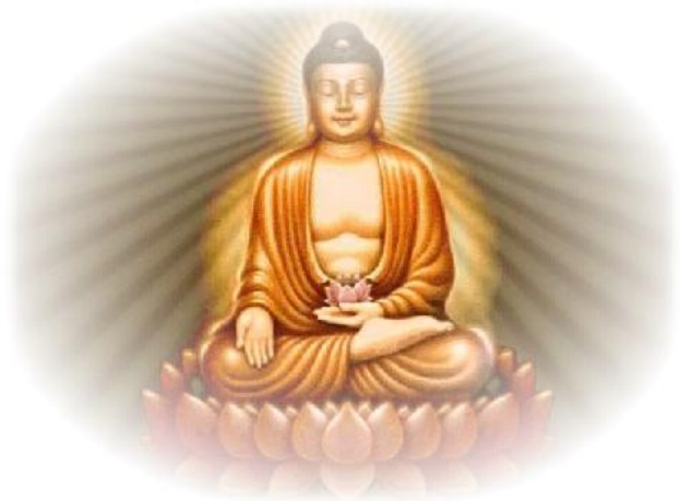
Будда, сидящий в позе лотоса