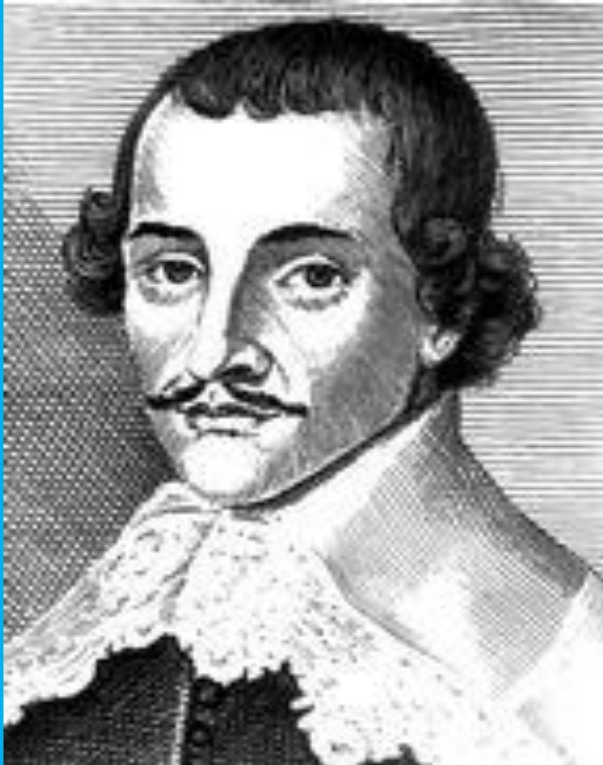
Джерард Уинстенли – диггеры