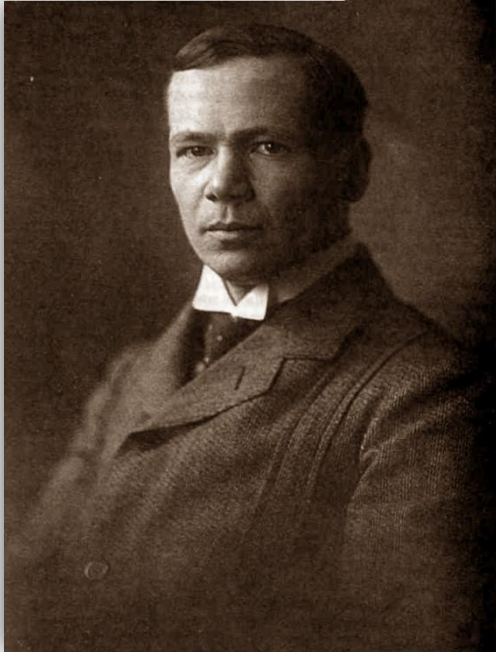
Густав Густавович Шпет (1879 – 1937)