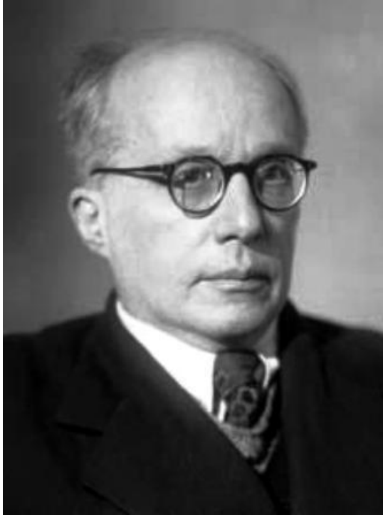
Сергей Леонидович Рубинштейн (1889 – 1960)