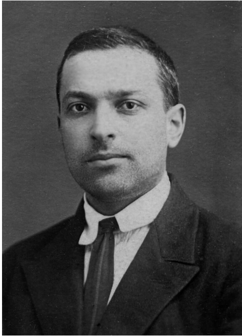
Лев Семенович Выготский (1896 – 1934)