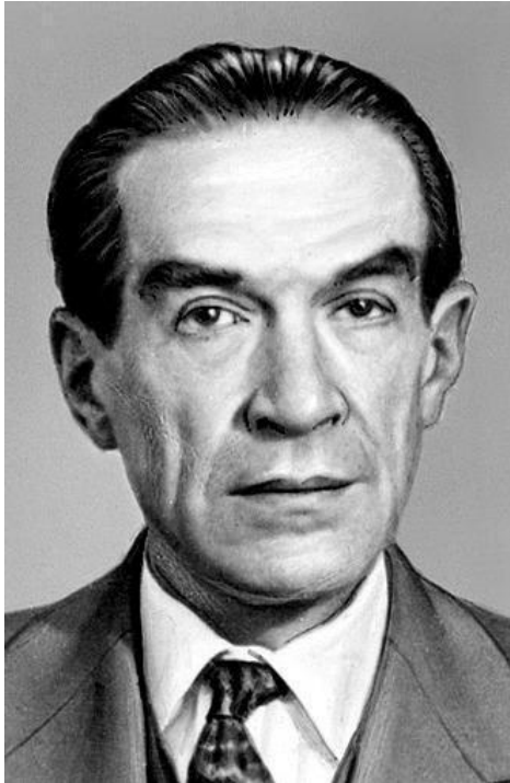
Алексей Николаевич Леонтьев (1903– 1979)