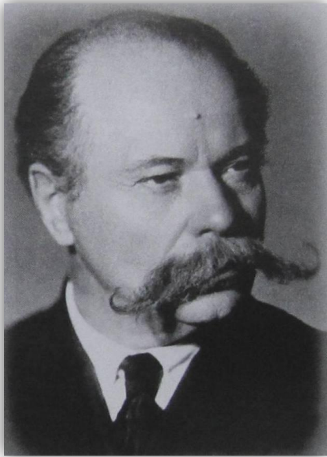
Константин Николаевич Корнилов (1879 – 1957)