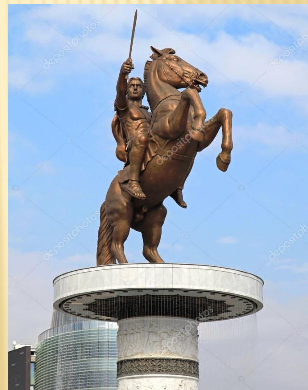
«Человек на лошади»