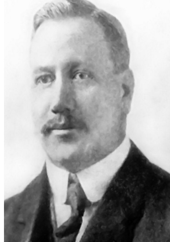
Уильям Дж. Морган