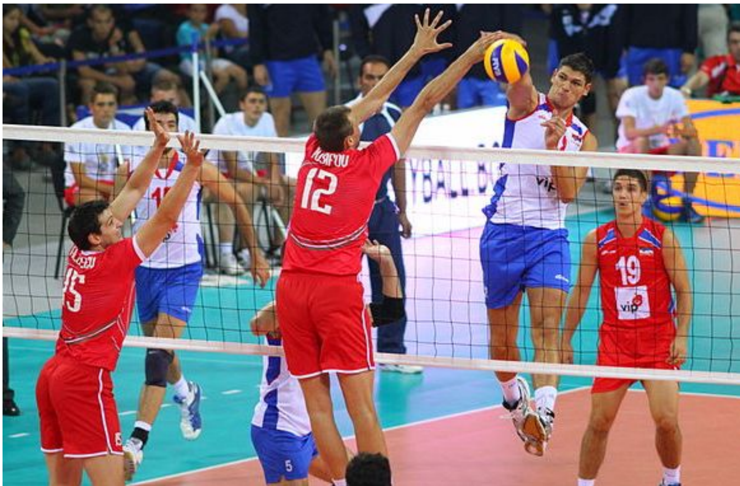
2011 год. Матч между сборными Сербии и Болгарии