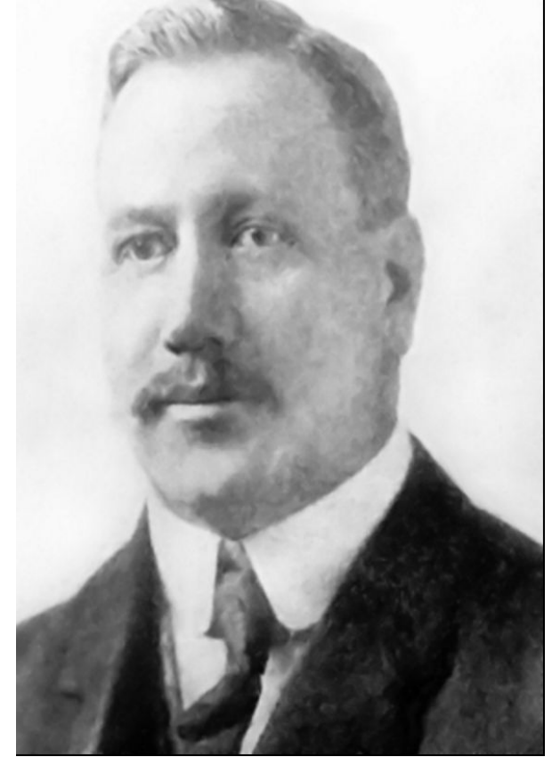
Уильям Дж. Морган