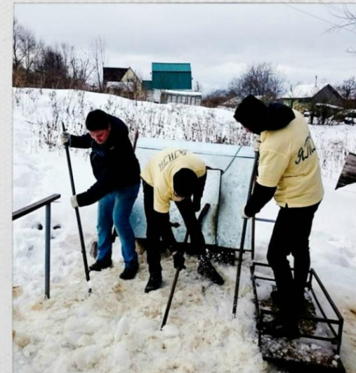
Расчистка дороги к колодезю с питьевой водой от льда и снега в пос. Боровковский Ясногорского района