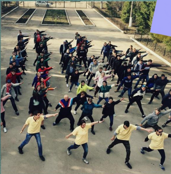
Производственная зарядка со студентами и сотрудниками техникума