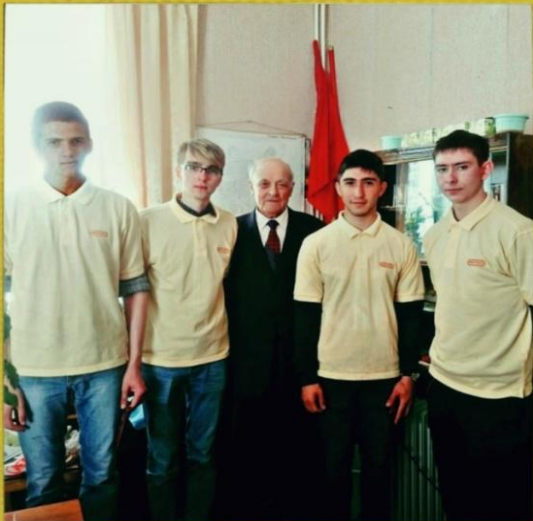
Особое направление волонтерского движения "МЫ ВМЕСТЕ" - встреча с ветеранами ВОВ.

С каждым годом ветеранов становится всё меньше. Это грустная реальность.