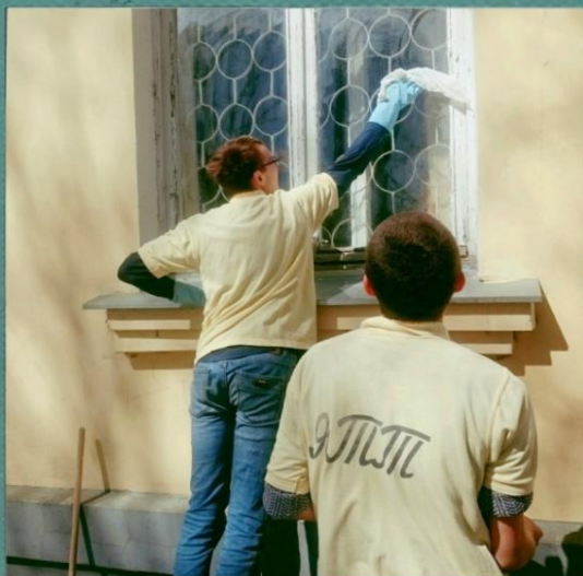
Акция "Чистые окна" - мытье окон в Совете Ветеранов Ясногорского района