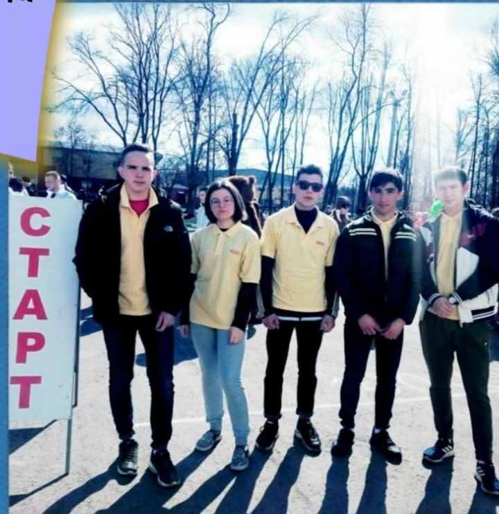
Всероссийская акция "10 000 шагов к жизни", посвященная Всемирному Дню Здоровья