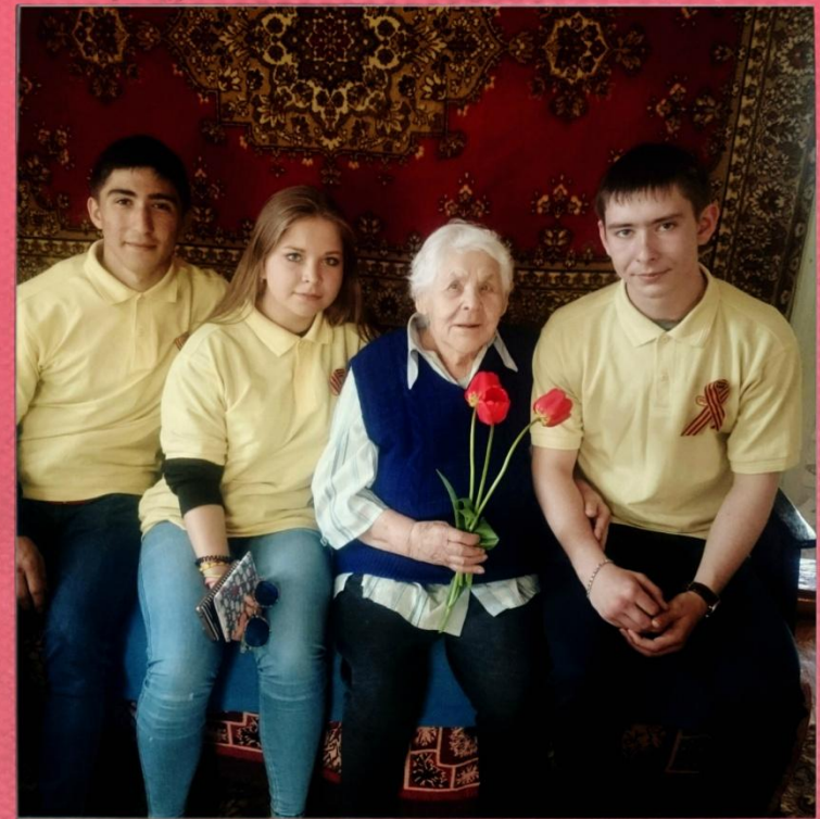
Уважение и почтение к старшему поколению - это отражение культуры и воспитания народа.

Волонтеры техникума с уважением относятся к ветеранам, к их прошлому и настоящему. Им есть чему у них поучиться.