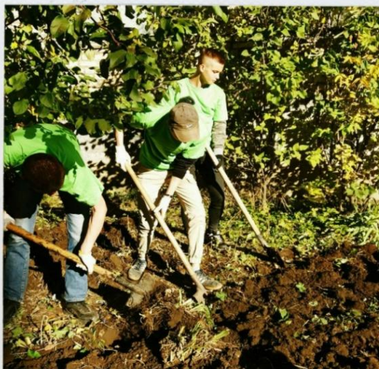
Облагораживание территории у Ясногорского районного художественно-краеведческого музея