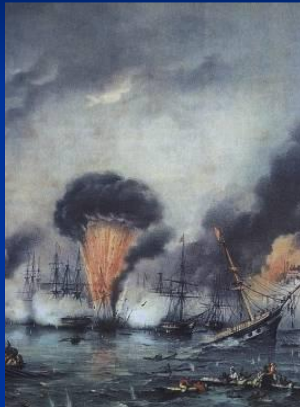
Сражение в Синопской бухте – последнее сражение парусного флота 18.11.1853