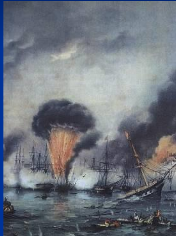
Сражение в Синопской бухте – последнее сражение парусного флота 18.11.1853