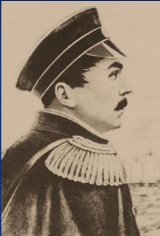
адмирал П. С. Нахимов.