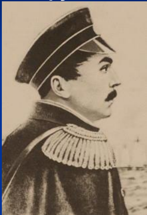
адмирал П. С. Нахимов.