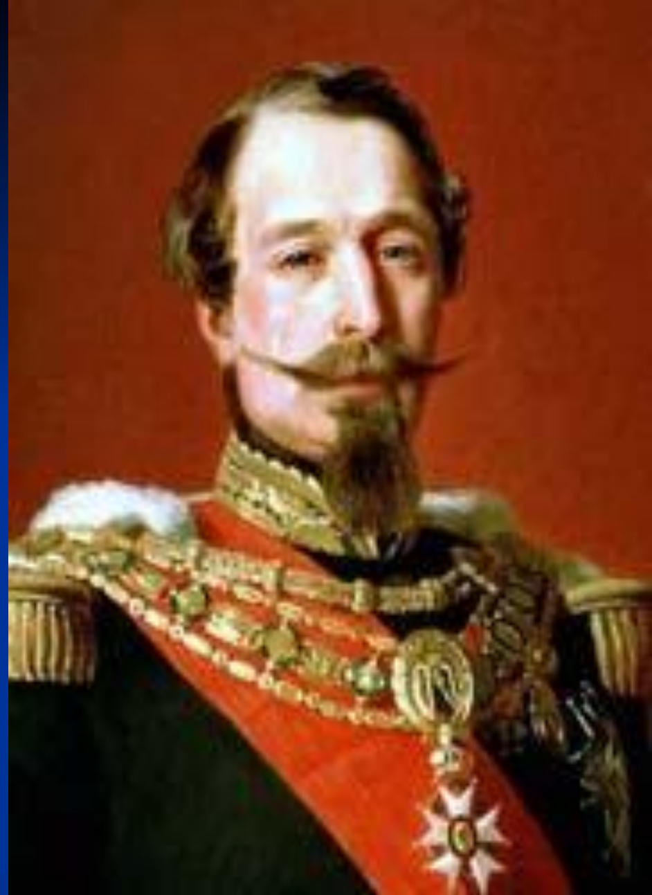
Луи Наполеон III (1851)