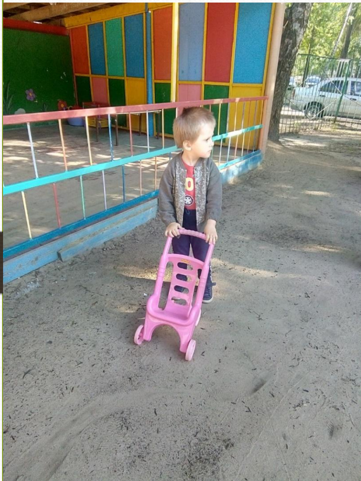
Сюжетно-ролевая игра «Семья»