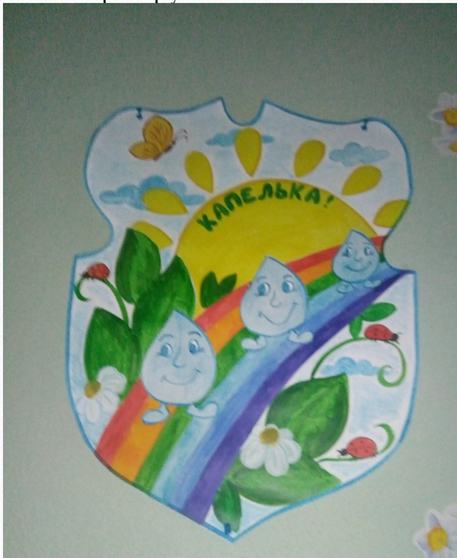
Герб группы №3