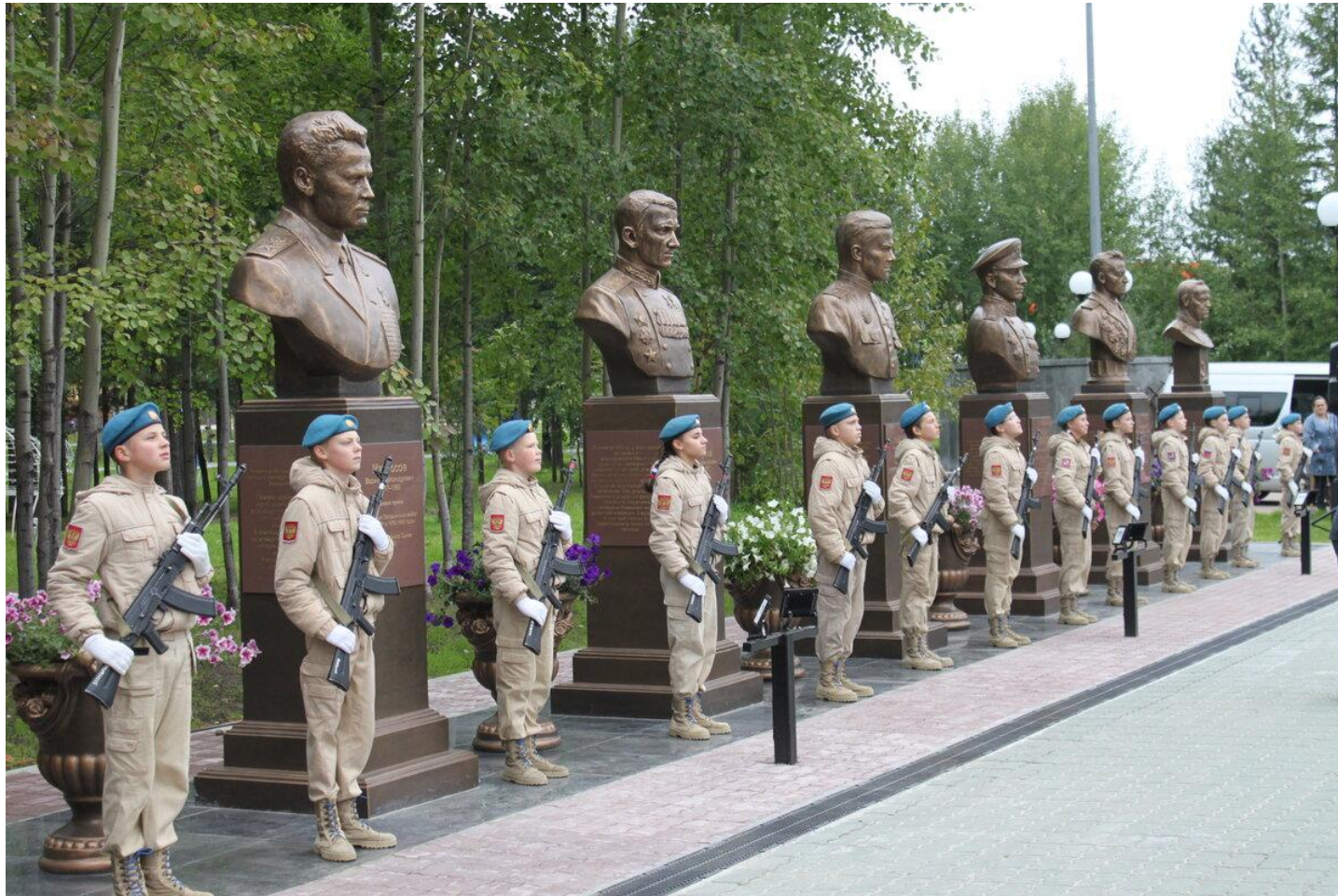
Аллея Российской славы площадь 3 мкр