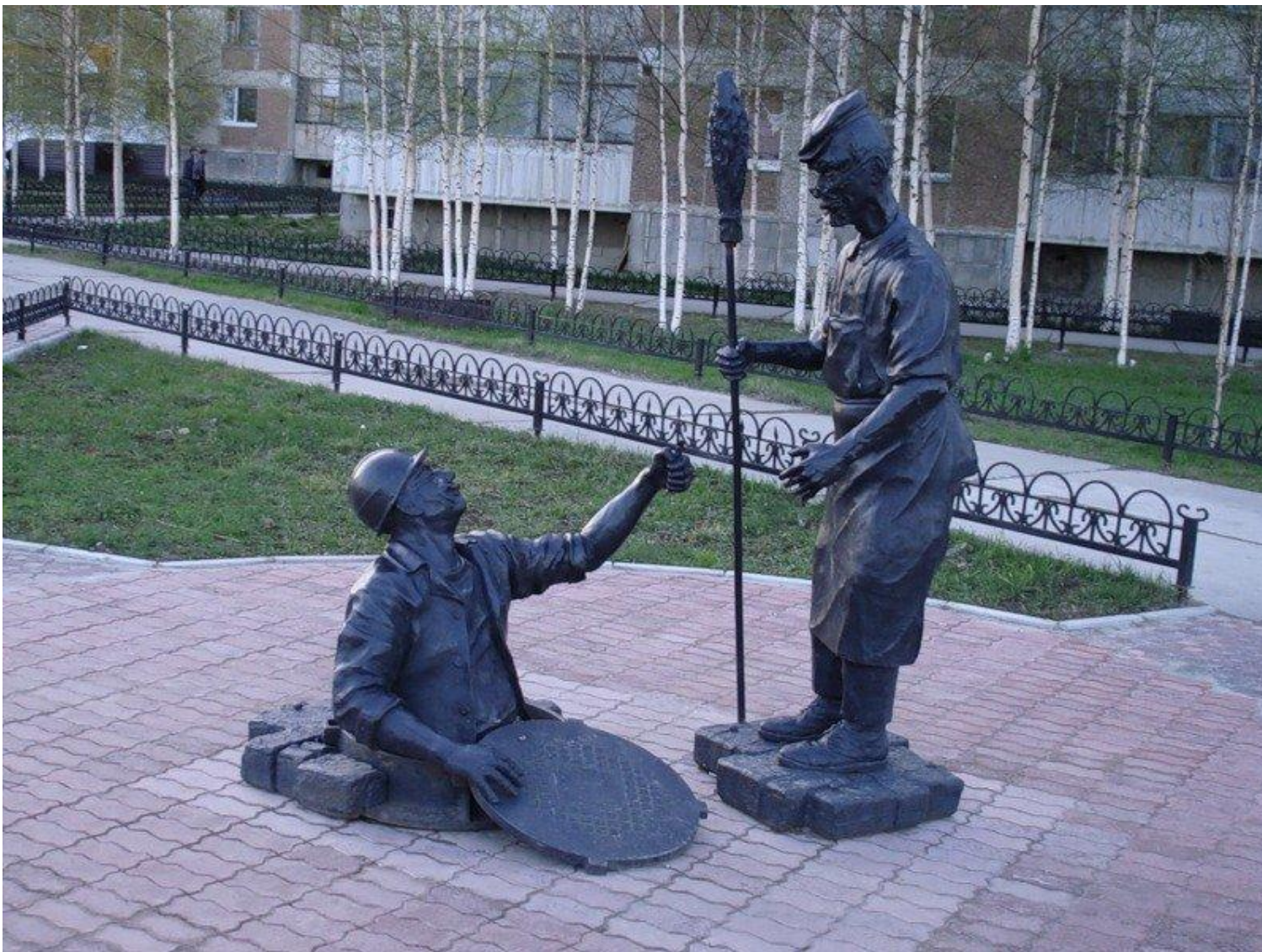
№3 Памятник Дворник и сантехник