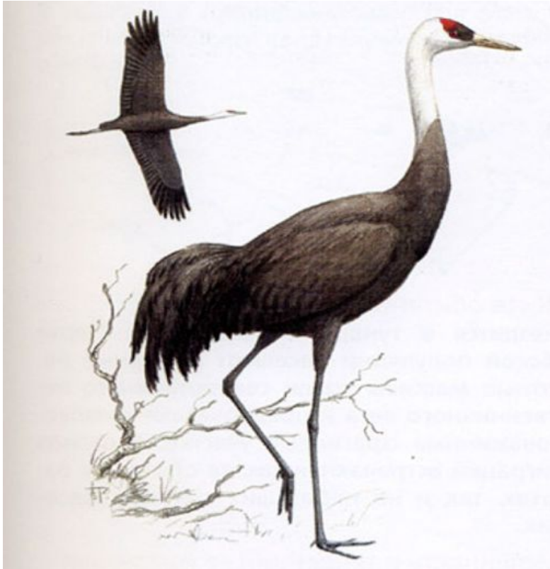
Кара дуруя- черный журавль