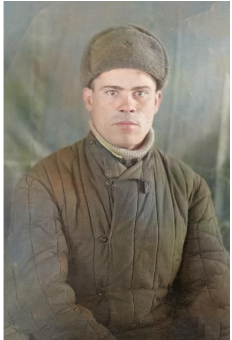
В качестве иллюстраций послужили фото Чиркина Петра Ивановича,