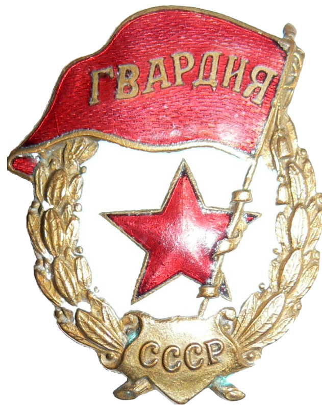
знак Гвардии СССР.