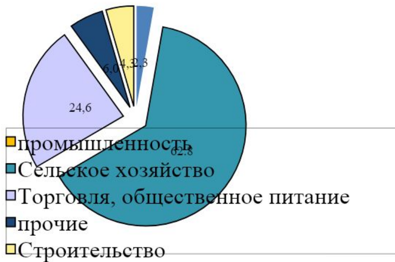
Рис. 1. Доля промышленного производства Упоровского района

В структуре ВВП наибольший удельный вес занимают сельское хозяйство (62,8%) и торговля (24,6%), доля промышленного производства составляет 2,3%.