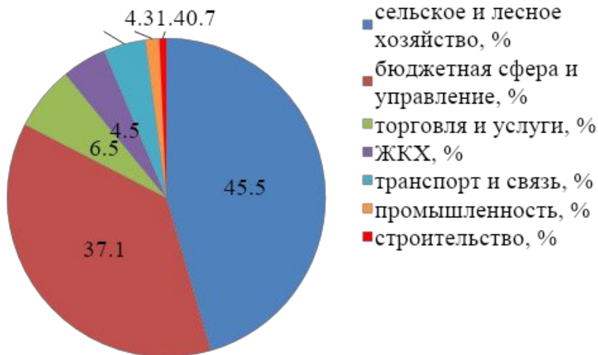
Рис. 2. Структура занятости населения

По итогам 2019 года индекс промышленного производства составил 113,2% к уровню 2018 года. Изображено на рисунке 2.