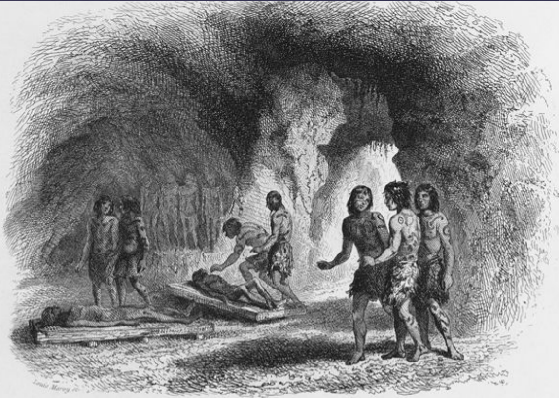
Caverne des Guanches.