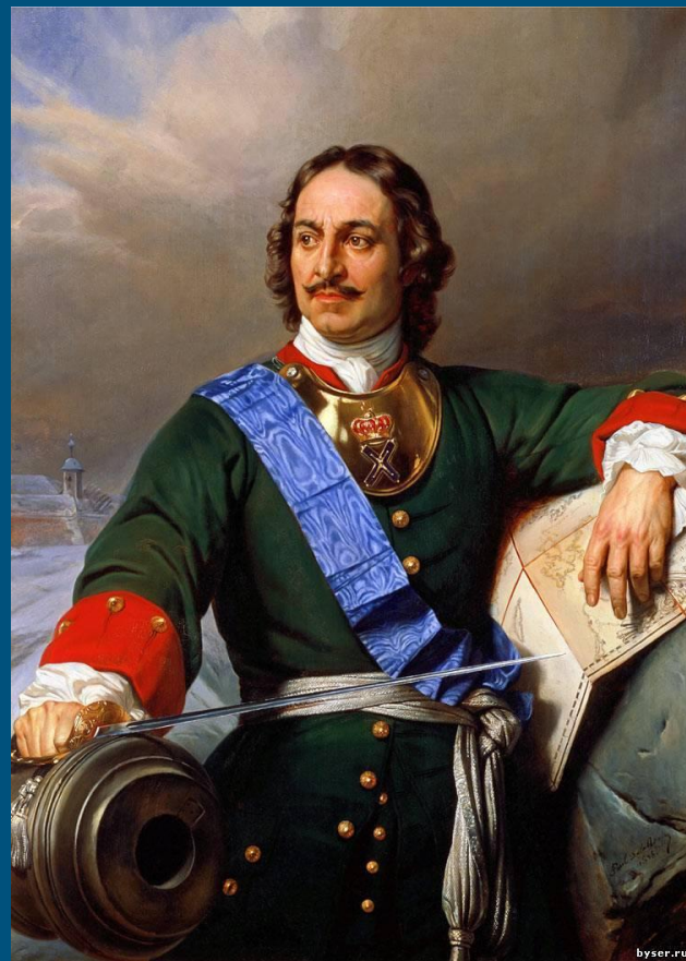
Поль Деларош. Портрет Петра I. 1838.

«Царь высок ростом, у него прекрасные черты лица и благородная осанка, он обладает большой живостью ума, ответы у него быстры и верны. Но при всех достоинствах, которыми надарила его природа, желательно было бы, чтобы в нем поменьше было грубости. Это государь очень хороший и вместе с тем очень дурной... Если бы он получил лучшее воспитание, то из него вышел бы человек совершенный, потому что у него много достоинств и необыкновенный ум».