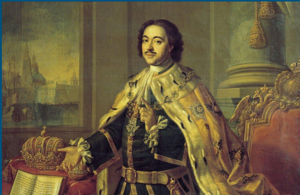
Алексей Петрович Антропов. Портрет Петра I. 1770.

О. Ключевский о Петре I: «Петр вышел непохож на своих предшественников, хотя между ними и можно заметить некоторую генетическую связь, историческую преемственность ролей и типов. Петр был великий хозяин, всего лучше понимавший экономические интересы, всего более чуткий к источникам государственного богатства. Подобными хозяевами были и его предшественники, цари старой и новой династии; но те были хозяева-сидни, белоручки, привыкшие хозяйничать чужими руками, а из Петра вышел подвижной хозяин-чернорабочий, самоучка, царь-мастеровой».