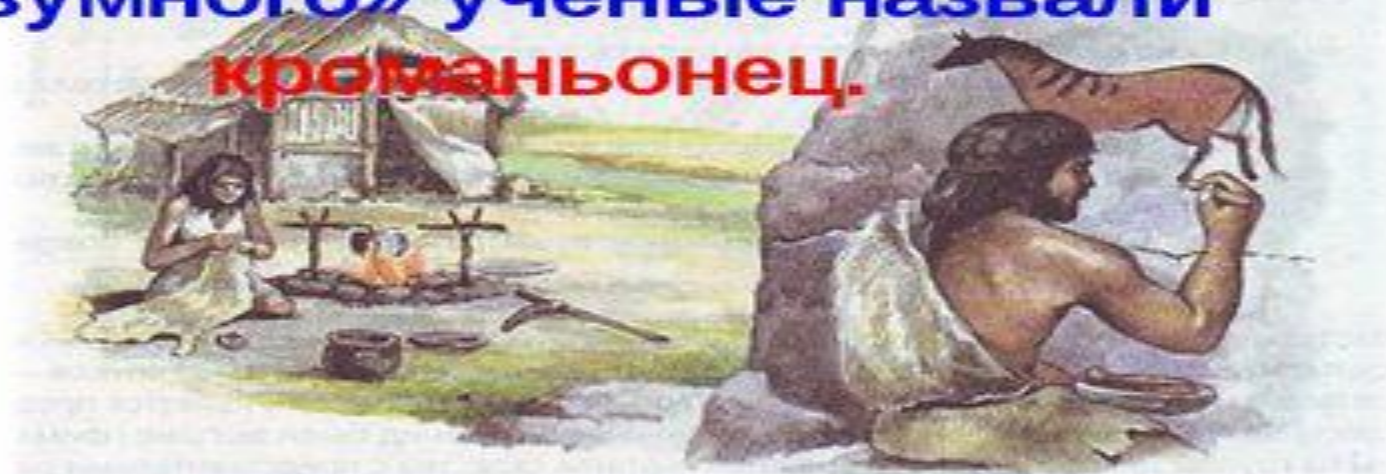
Рис. 110. Кроманьонцы