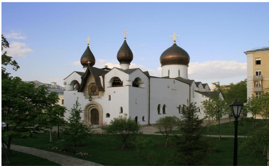
Марфо - Марьинская обитель