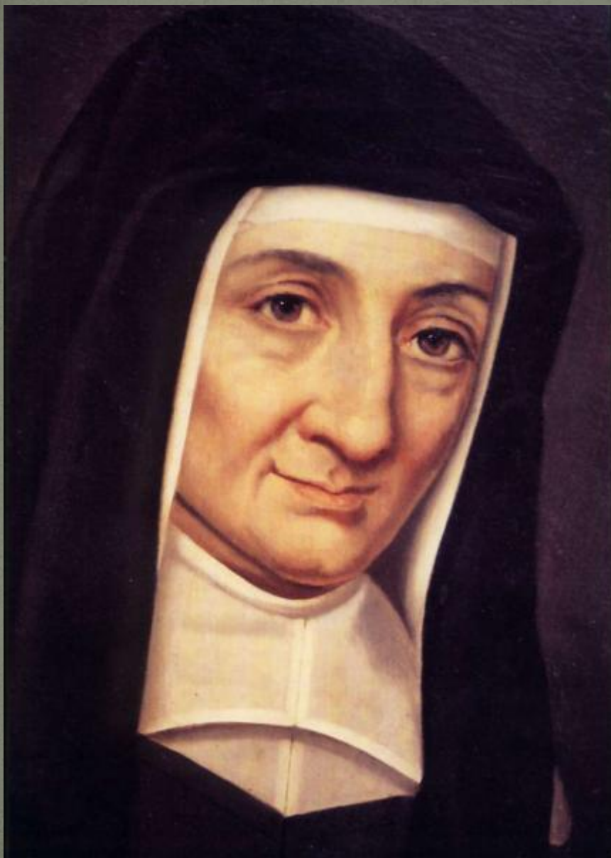
Луизу де Марийак