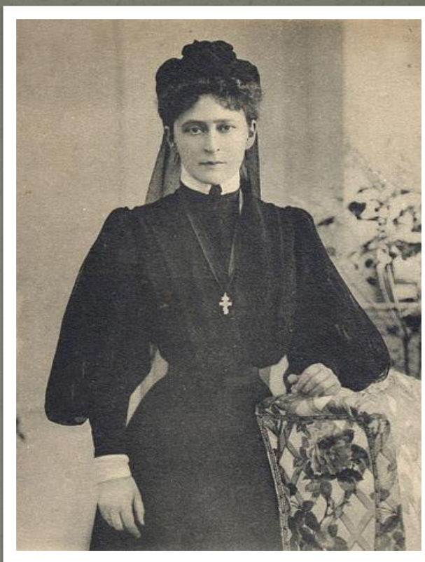
Великая княгиня Елизавета Федоровна