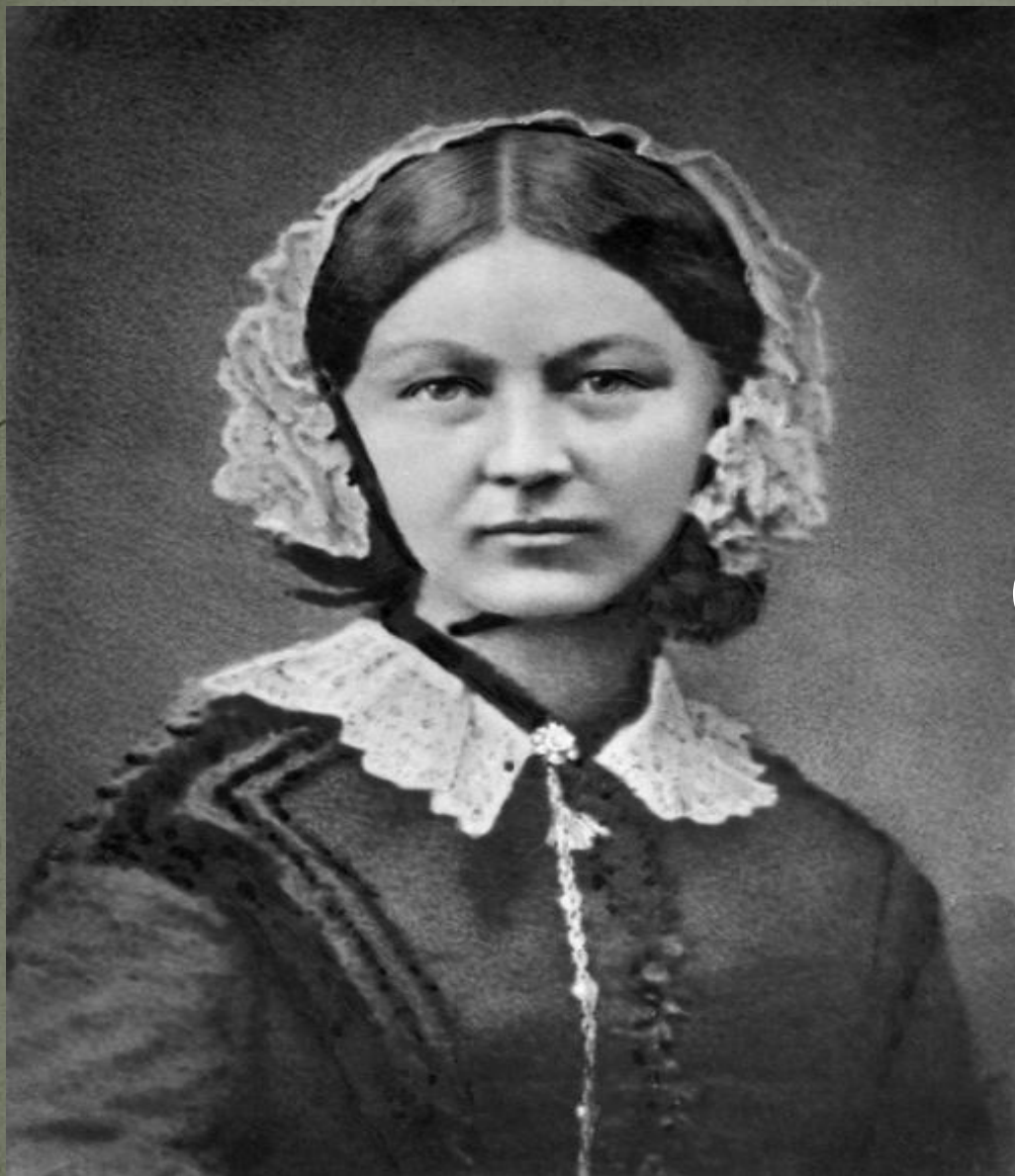
Флоренс Найнтингейл (12 мая 1820г.-1910г.)