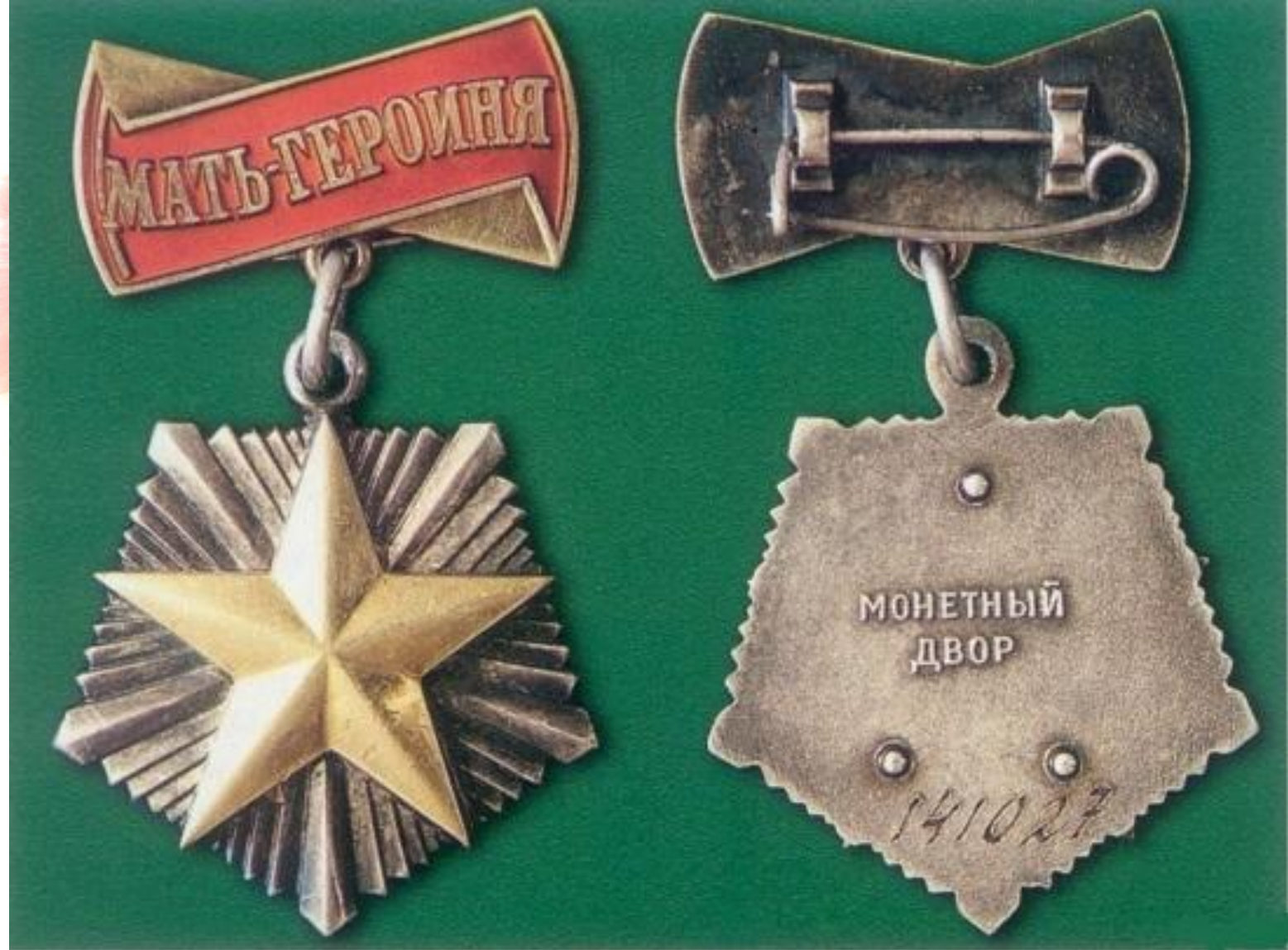
Орден «Мать – героиня»