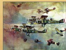
Воздушный бой в небе Франции