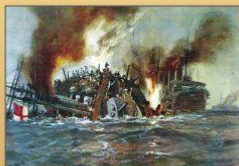
Гибель английского крейсера, 1914 г.