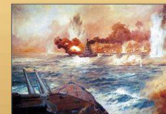
Ютландское сражение между британским и германским флотом, 1916 г.