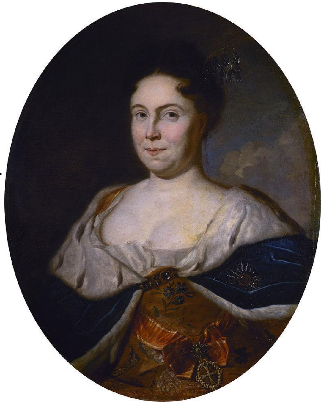
Портрет Екатерины I работы Карела де Моора, 1717 года.

Екатерина родила мужу 11 детей, но почти все они умерли в детстве, кроме Анны(1708) и Елизаветы (1709). Елизавета позже стала императрицей, а прямые потомки Анны правили Россией после смерти Елизаветы, с 1761 по 1917.