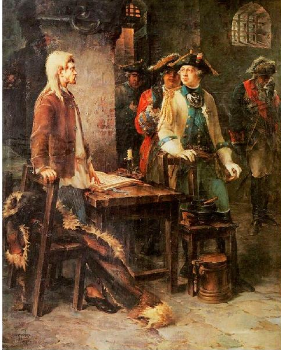
Император Петр III посещает Ивана VI Антоновича в Шлиссельбургской крепости ,1762 год. Ф. Буров.