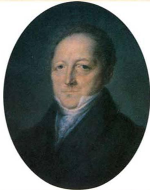
Отец Пушкина — Сергей Львович (1767—1848)