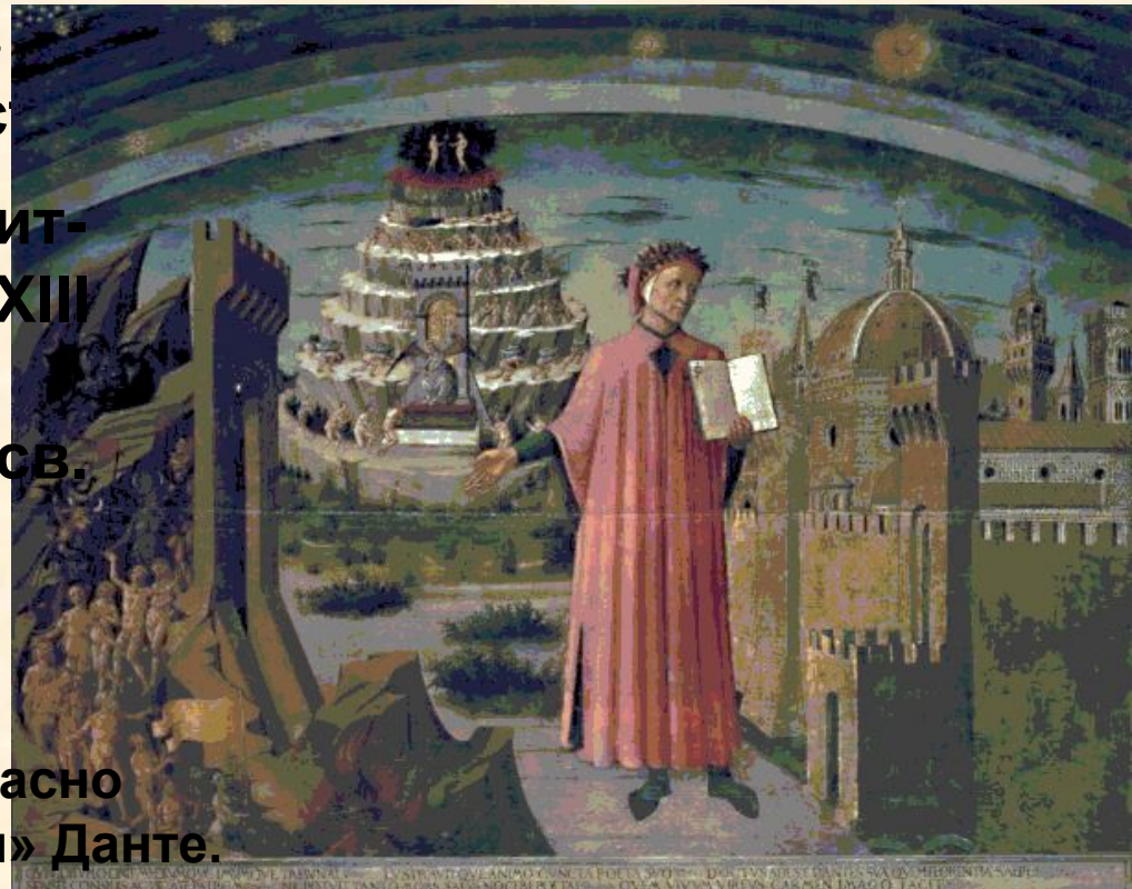
Панорама мира согласно «Божественной комедии» Данте.