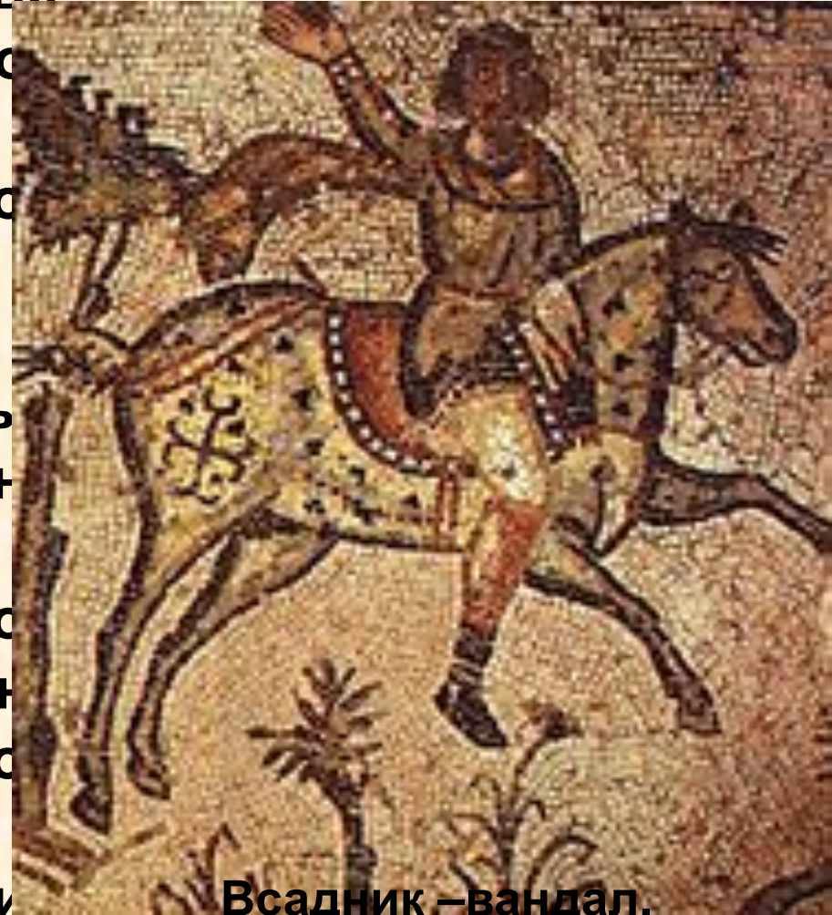
Всадник – вандал.

Европейский мир принимает христианский облик, начиная с IV в.