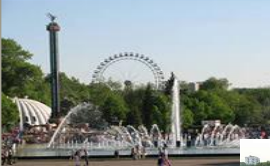
им. Горького Центральный парк