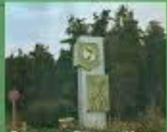
Выполнил Стеллер Иван учащийся 3 класса