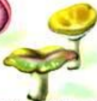
Сыроежка летняя, желтая, красная