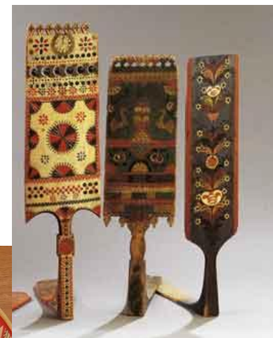
Прялки Русског о Севера