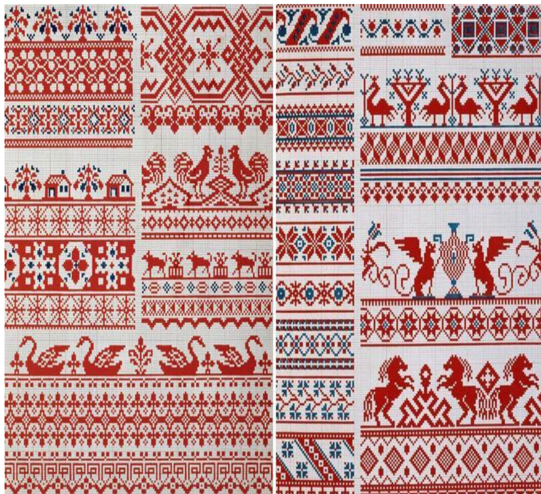
Владимировская, Костромская, Калининская, Московская вышивки

Для русского народного ДПИ характерны изображения символов, солярных знаков наличие красного цвета и белого. Белый - связан с чистотой, светом, с понятием о благе. Красный был главным, символом огня, силы, жизни, красоты.