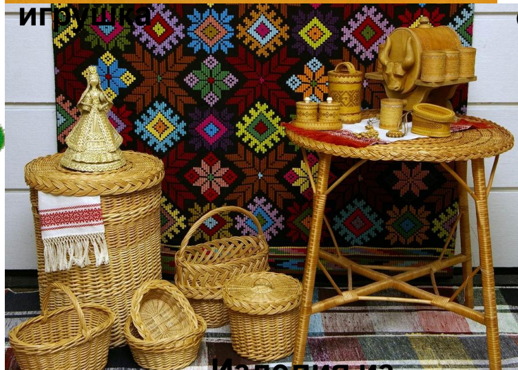
Изделия из бересты