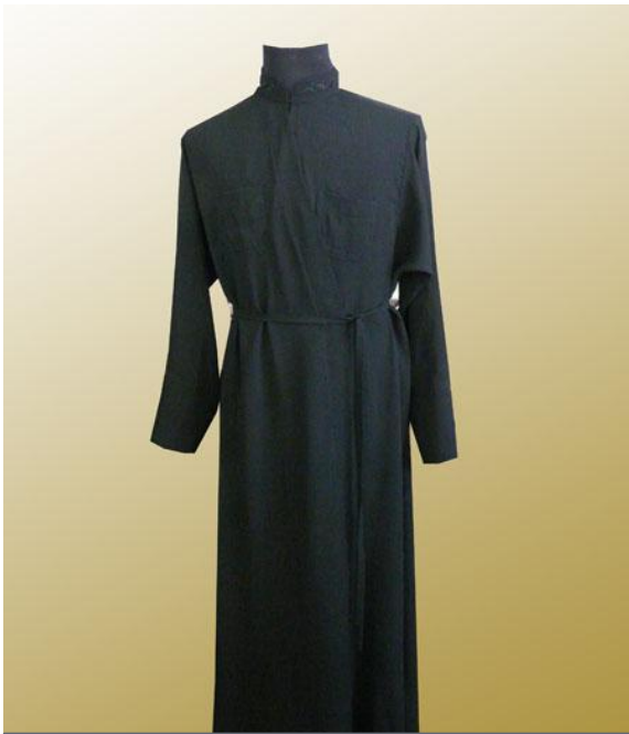
Р Я С А