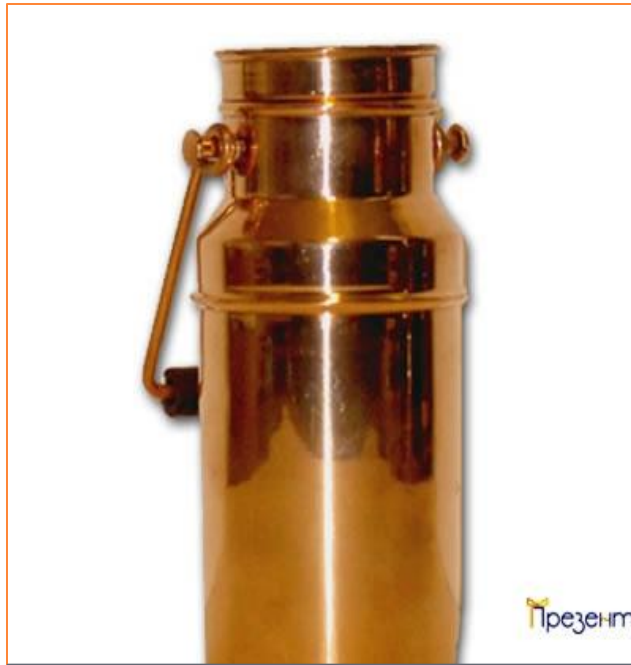
Б И Д О Н