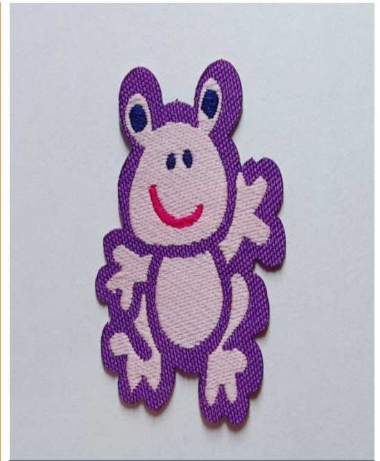
Н А Ш И В К А