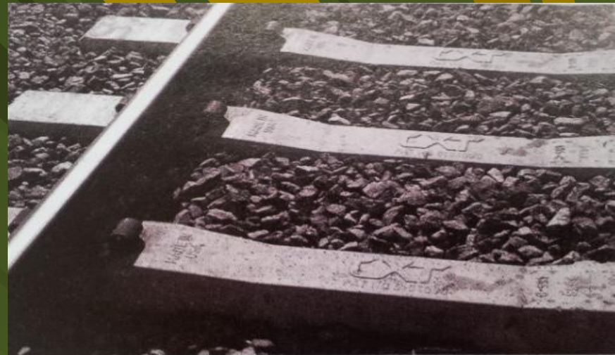
Рис. 1. Путь на железобетонных шпалах компании СХТ

Шпалы с точки зрения экологии // Железные дороги мира. -2011. - № 6. - С. 63-65.