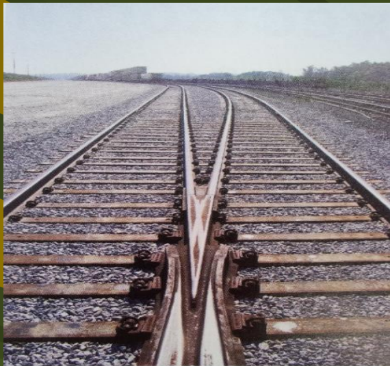
Рис. 3. Путь на стальных шпалах компании NARSTCO

Шпалы с точки зрения экологии // Железные дороги мира. -2011. - № 6. - С. 63-65.