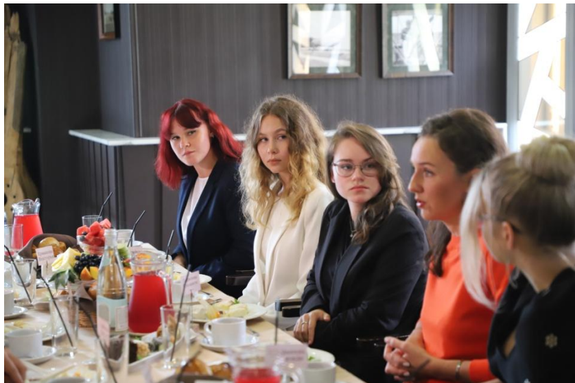
Фото завтрак с министром, фото слёта выпускников)

Результаты госэкзаменов _____ детей 220+ _____ детей поступили в колледжи и Вузы