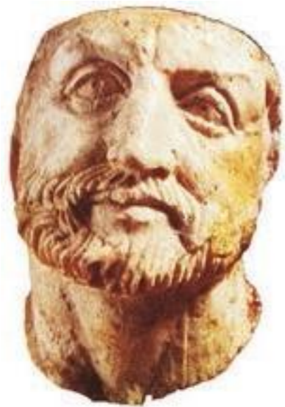
Филипп Македонский. Древнегреческая скульптура

Македонией называют гористую страну, расположенную на севере Балканского полуострова. Главным занятием ее жителей было коневодство, земледелие играло второстепенную роль. Македонские племена были родственны грекам и говорили на схожем с ними языке. Они переняли многие достижения эллинов. Например, пользовались греческим алфавитом, поклонялись тем же богам, что и их южные соседи. Долгое время Македония оставалась раздробленной на множество мелких царств. В IV веке до н. э. умный и энергичный правитель Филипп II сумел объединить страну.