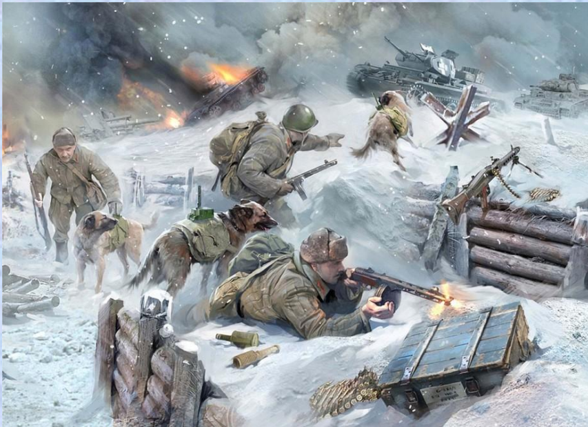
Панорама 1 "Истребители танков с собаками" (слева)