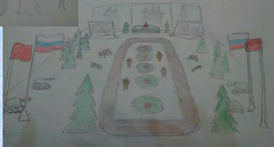
Рисунок в цвете