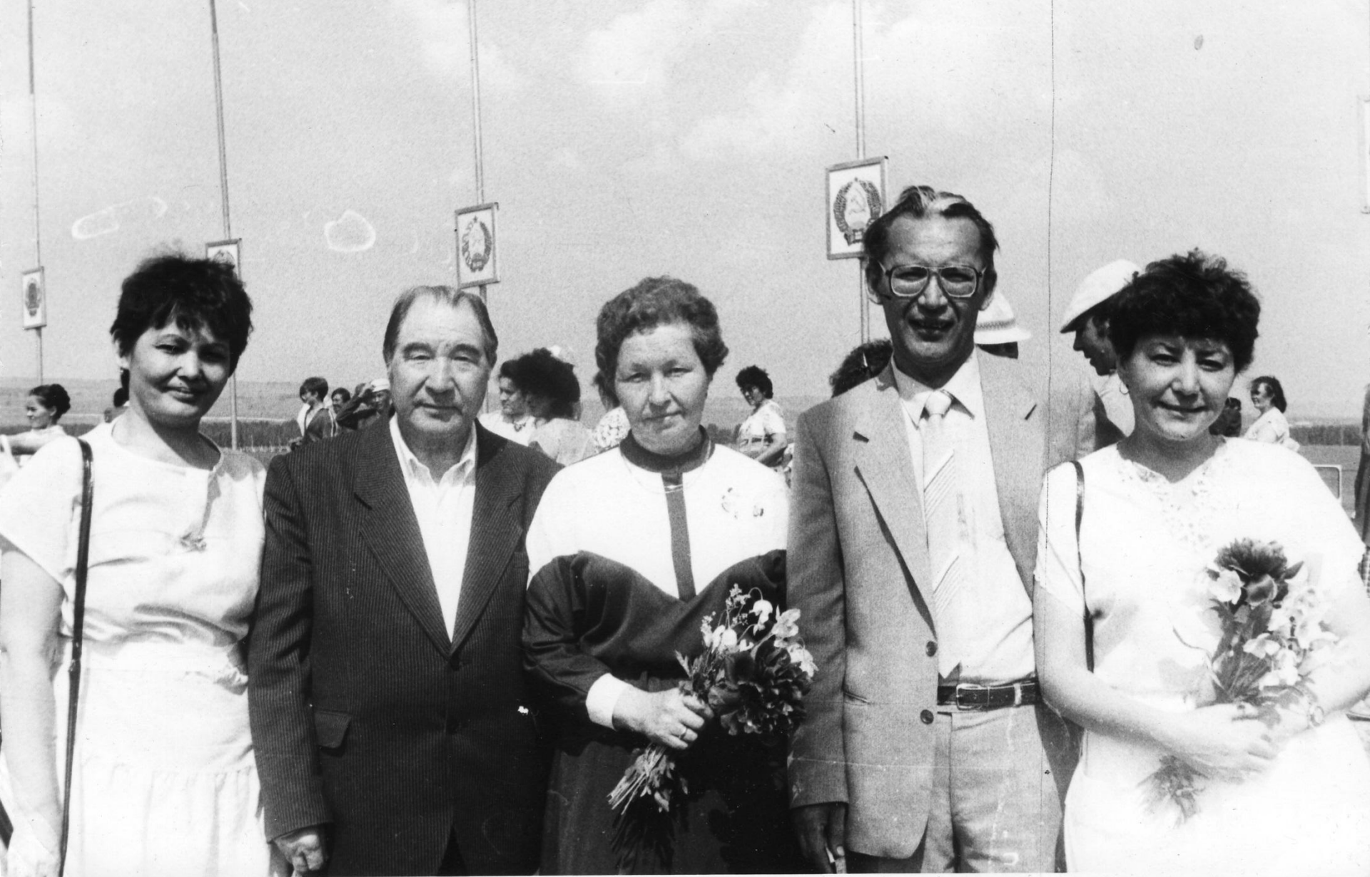
Район һабантуйында кунакта якташтар менән