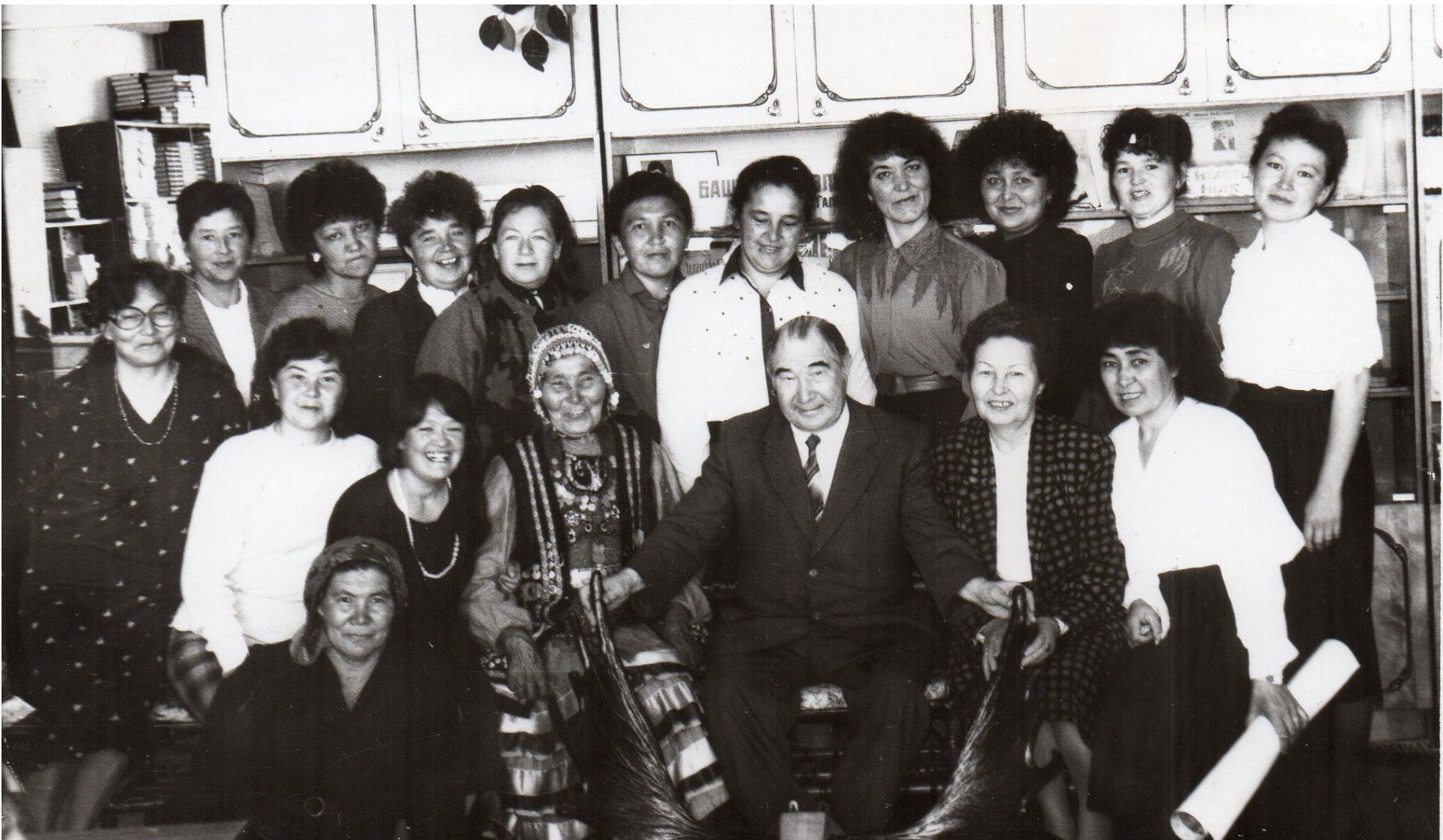
Шағир үзәк китапхананың көтөп алынған кунағы