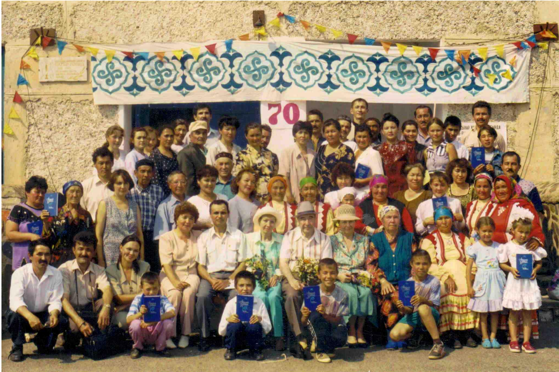
Тыуған Күсей ауылында юбилей