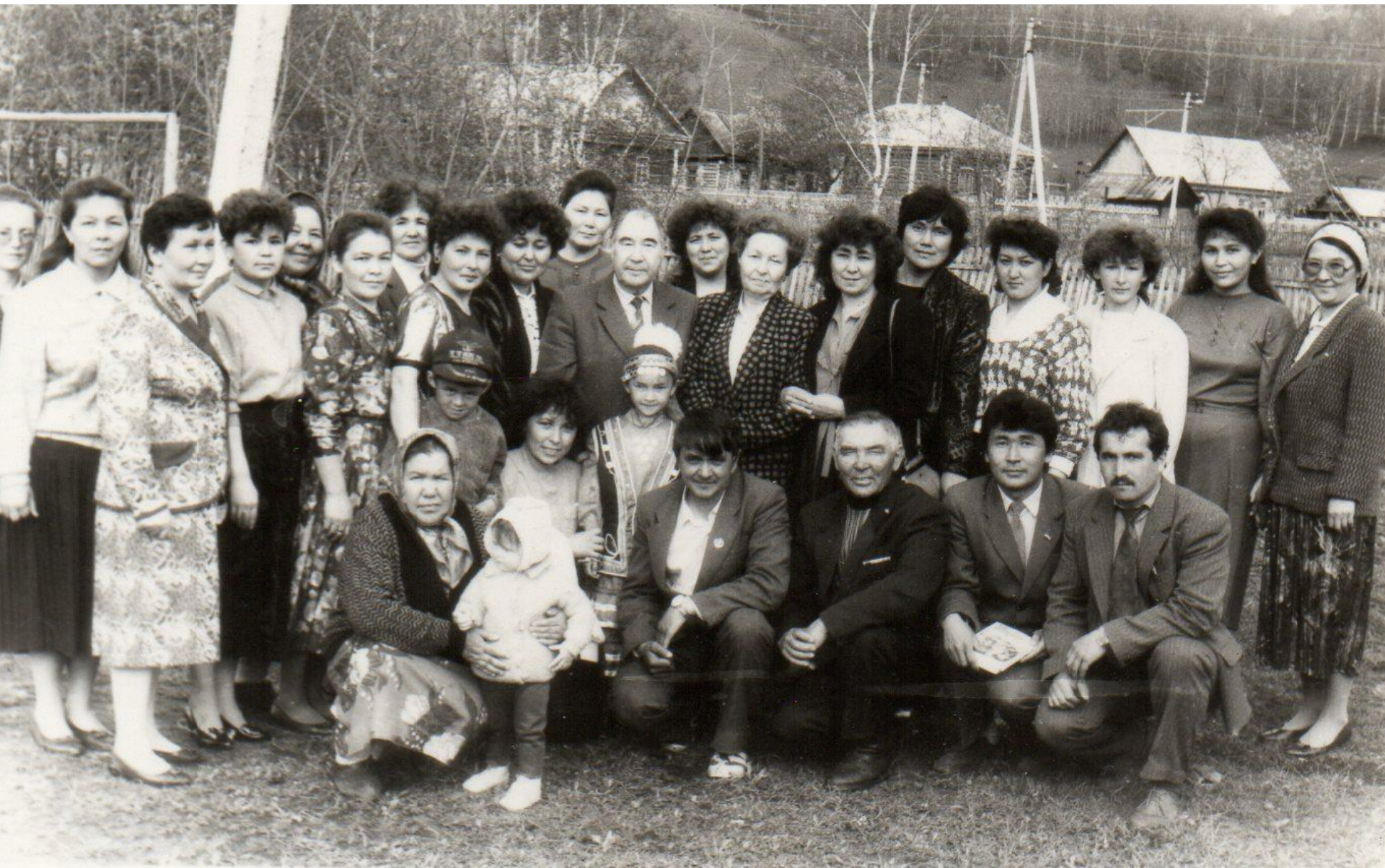
Комсомол ауылында осрашыузан һуң, 1994 йыл