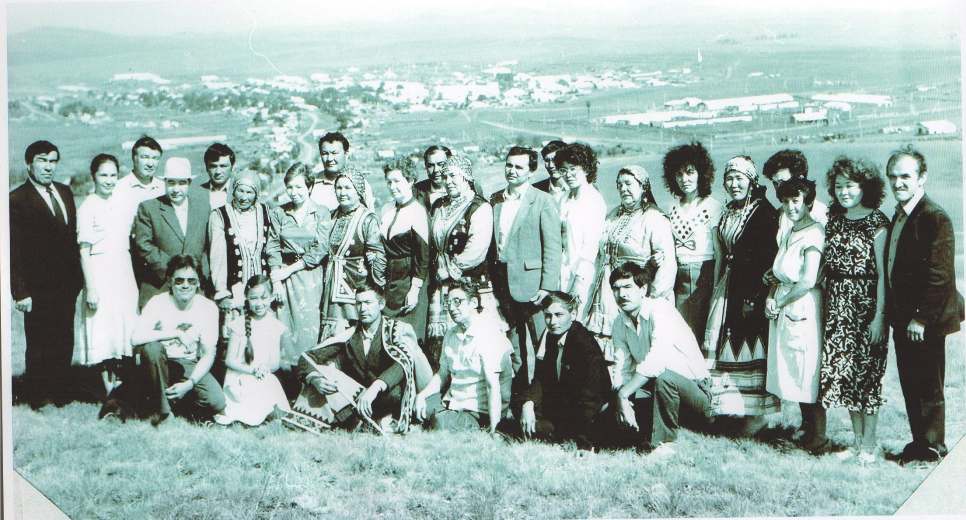
Шағирзың 60 йәшлек юбилейы, Тоғажман тауында, 1990 йыл