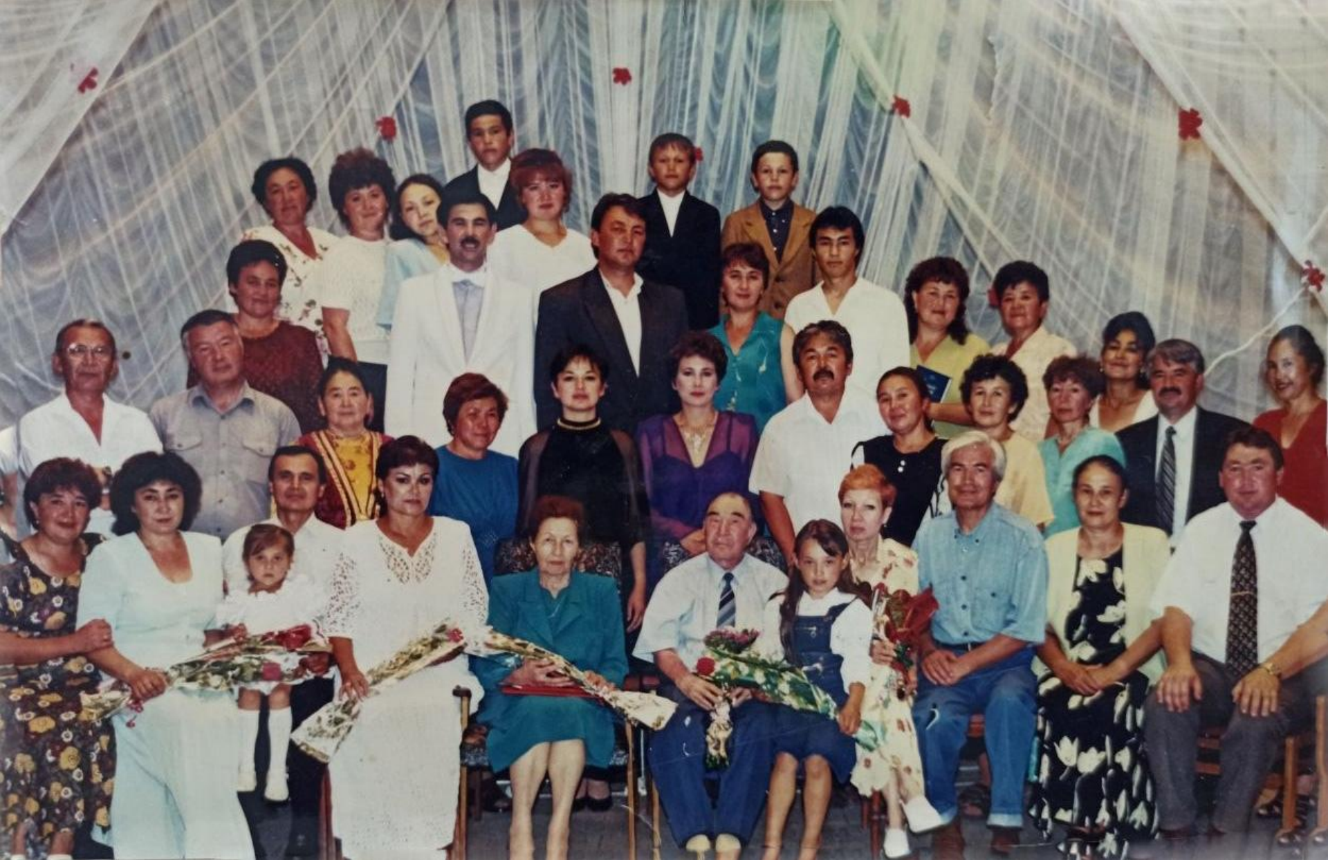
Шағирзың 70 йәшлек юбилей кисәһе Баймакта