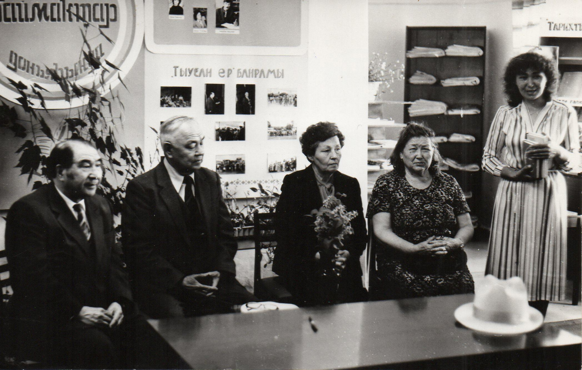
Үзәк китапханала осрашыу