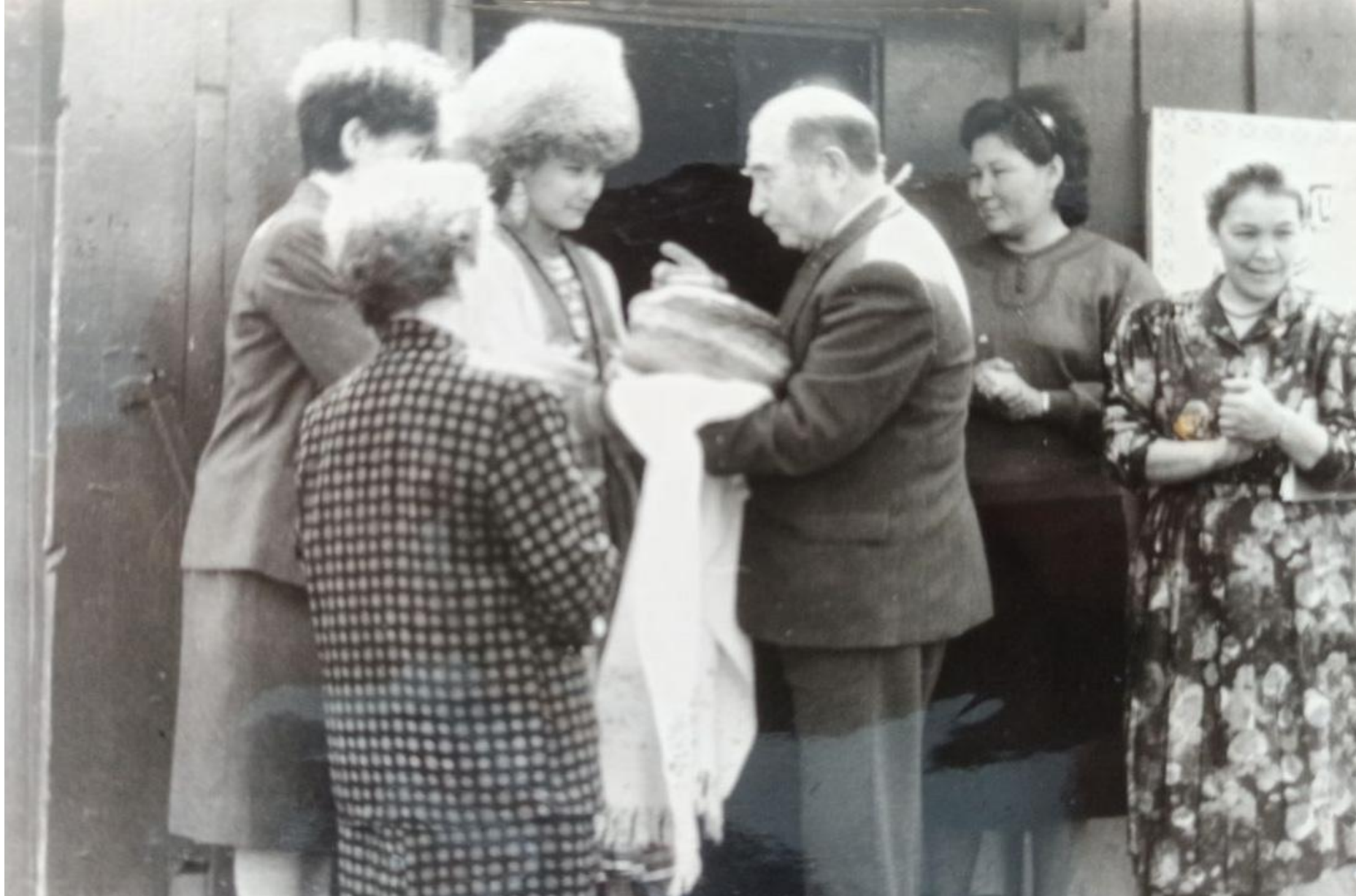
Хөрмәтле кунактарҙы каршы алыу, Комсомол ауылында