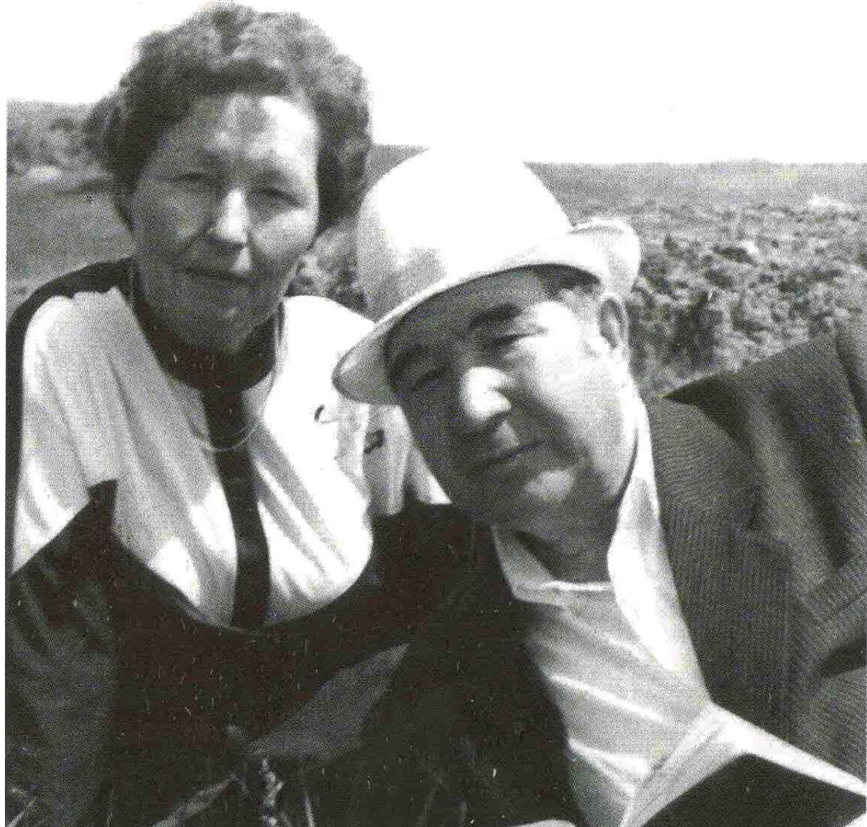
Катыны Маһизә менән тәбиғәт косағында. Күк Ирәндәк буйзары.