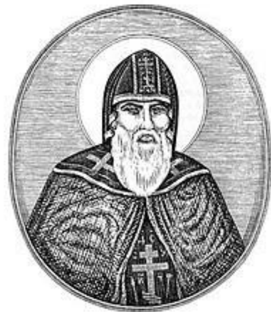
Преподобный Нил Сорский

Митрополит-нестяжатель Зосима: «Достоит еретиков проклятию предати и сослать на покаяние, зане мы от Бога не поставлены на смерть осуждати, но грешныя обращати к покаянию».