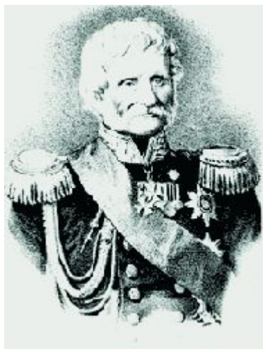
А.А. Жомини (1779-1869 гг.)

Логистика - практическое искусство управления войсками, включающее широкий круг вопросов, связанных с планированием, управлением и снабжением, определением мест дислокации войск, транспортным обслуживанием армии и т.п.