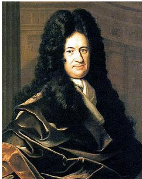
Г.В. Лейбниц (1646 - 1716)

Логистика - символическая логика, новейшая разновидность формалистической логики.