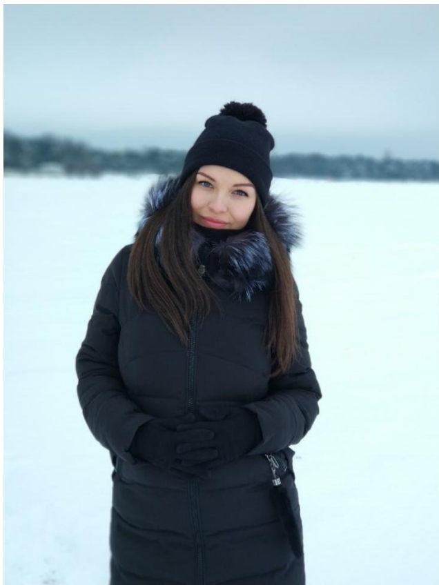
Анна Александровна Финансовая отчётность