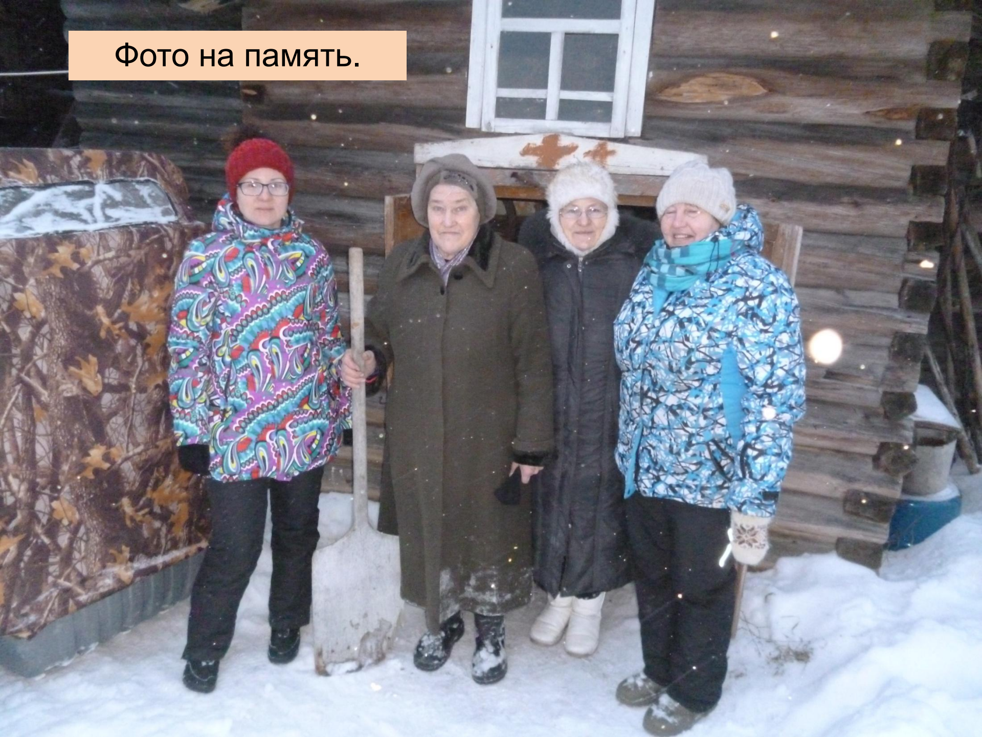
Фото на память.