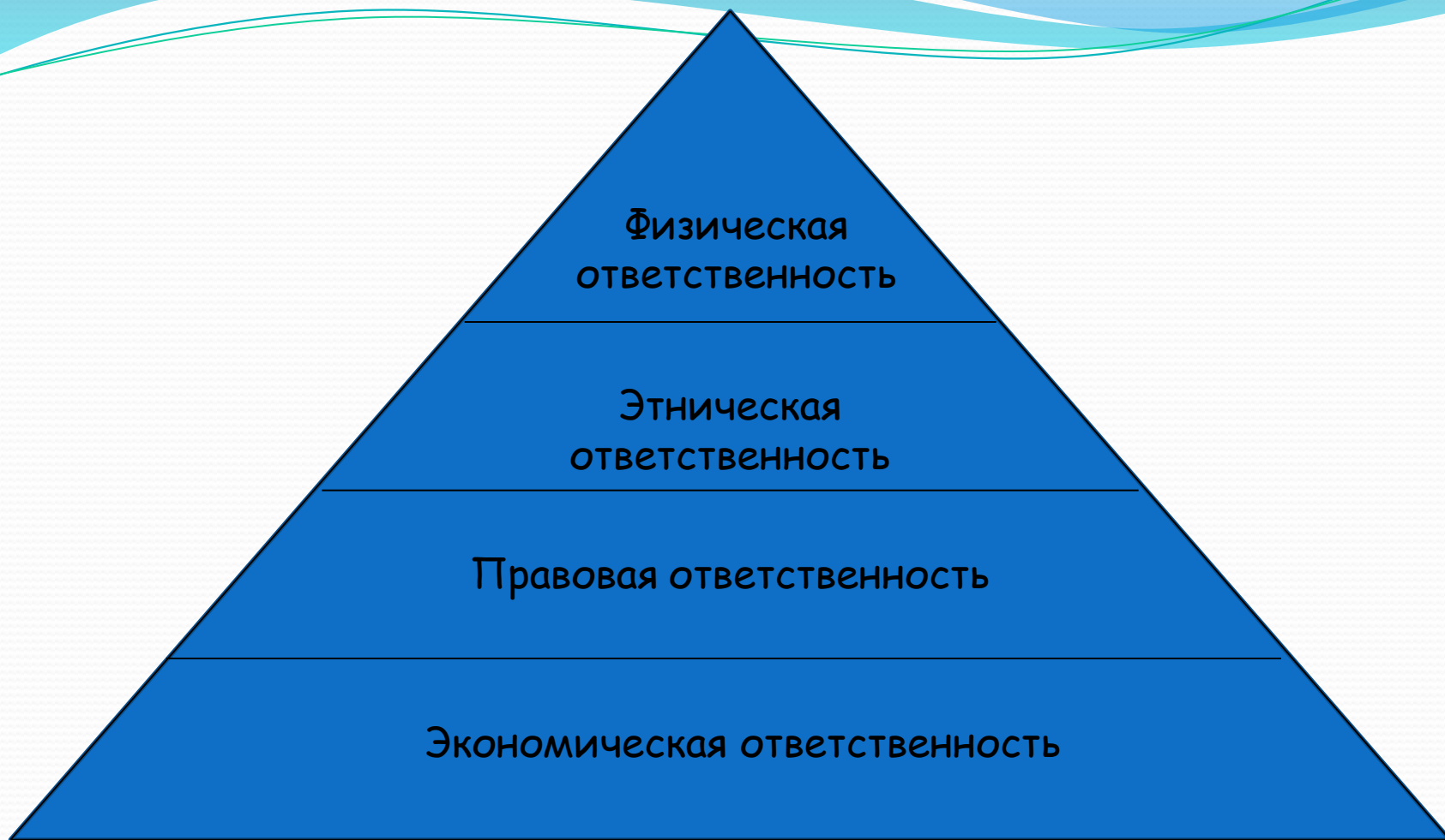
Рис. 1. Пирамида корпоративной социальной ответственности