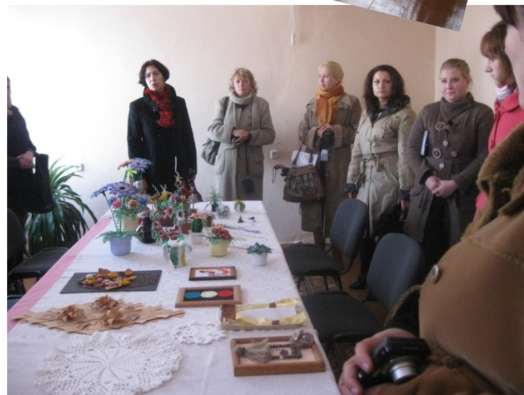
Выездное заседание областной школы МЕТОДИСТОВ