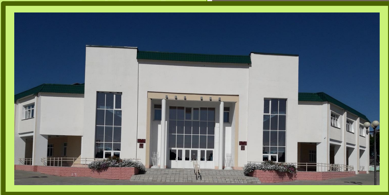
ГУК «Централизованная клубная система Чериковского района»