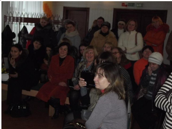
«Организация методического сопровождения Семинар в рамках реализации образовательной программы повышения квалификации методистов ЦКС Могилёвской области»