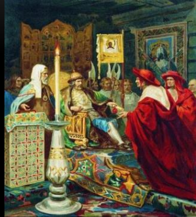
“Александр Невский принимает папских легатов”