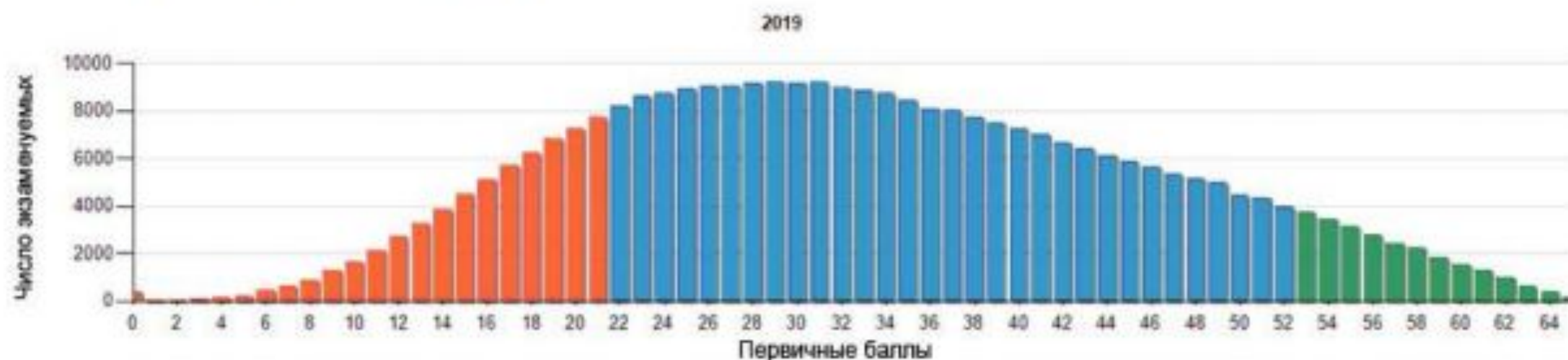
Рис. 1. Кривая распределения первичных баллов ЕГЭ 2019 г.

На рис. 1 приведено распределение первичных баллов участников экзамена.