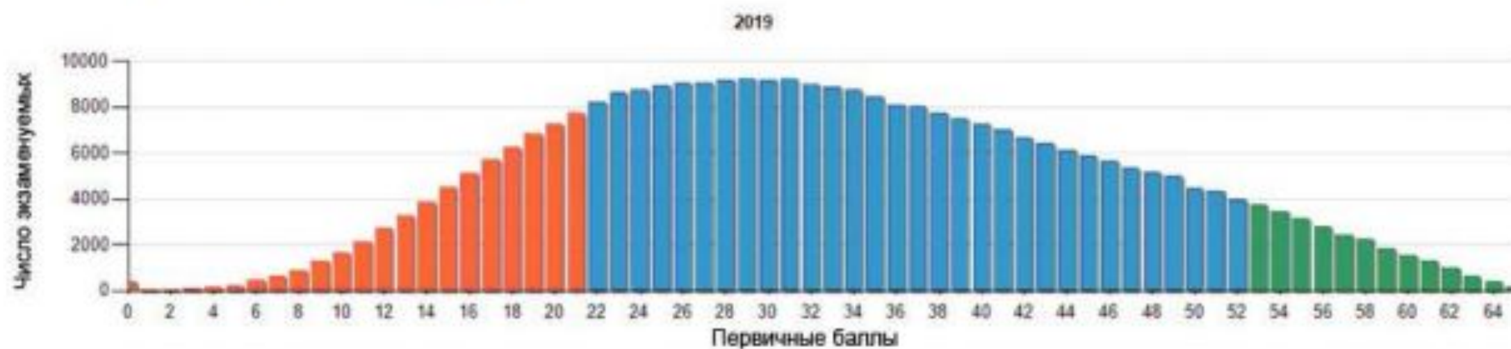
Рис. 1. Кривая распределения первичных баллов ЕГЭ 2019 г.

На рис. 1 приведено распределение первичных баллов участников экзамена.