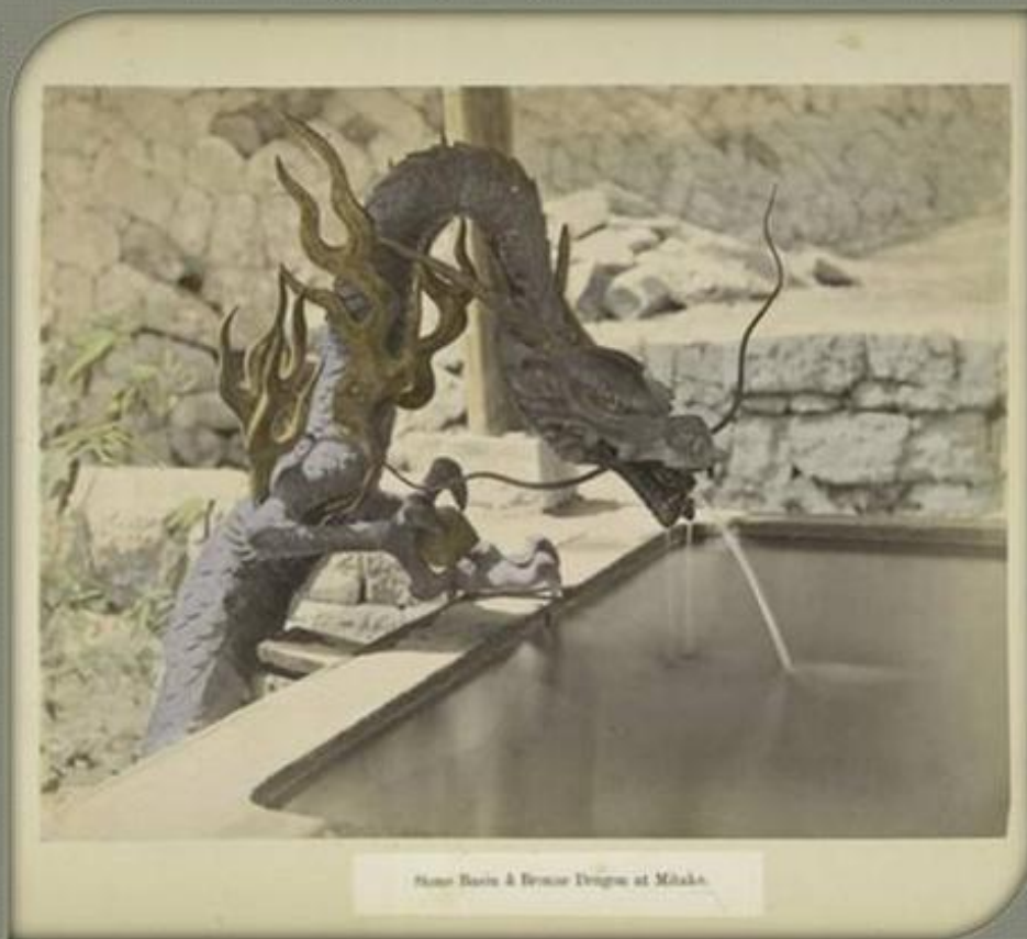
Stone Basin & Dragon Design at Mikako.

Многие в Японии были недовольны мирным договором: Япония получала меньше территорий, чем ожидалось — например, только часть Сахалина, а не весь, а главное, не получала денежных контрибуций. Во время переговоров японская делегация выдвинула требование о контрибуции в 1,2 миллиарда иен, но твёрдая и непреклонная позиция Витте не позволила уступить в этих двух принципиальных пунктах. Его поддержал президент США Теодор Рузвельт, сообщив японцам, что если они будут настаивать, то американская сторона, до того симпатизировавшая японцам, изменит свою позицию. Так же было отвергнуто требование японской стороны о демилитаризации Владивостока и ряд других условий.