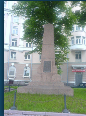
Памятный знак Роберту Робертовичу Марфельду