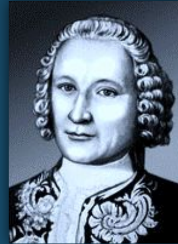
Савва Иванович Чевакинский