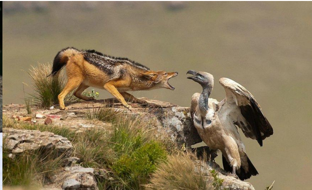
взаимное конкурентное подавление