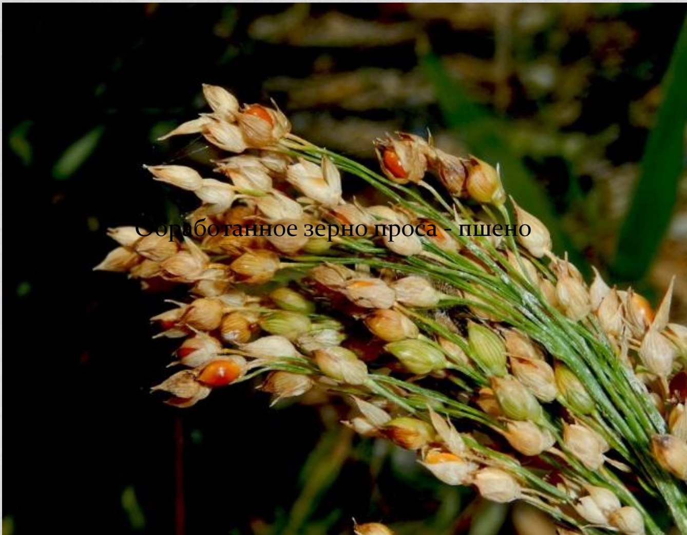
Сорботанное зерно проса - пшено