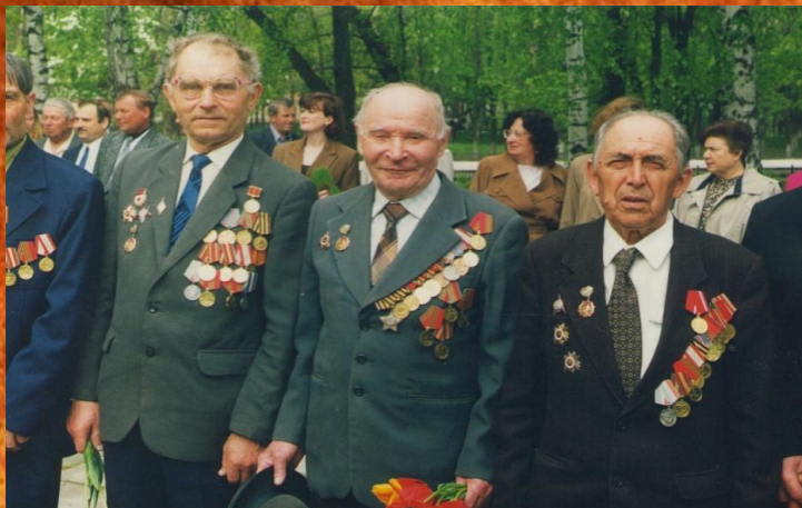
Поколение 40-х годов