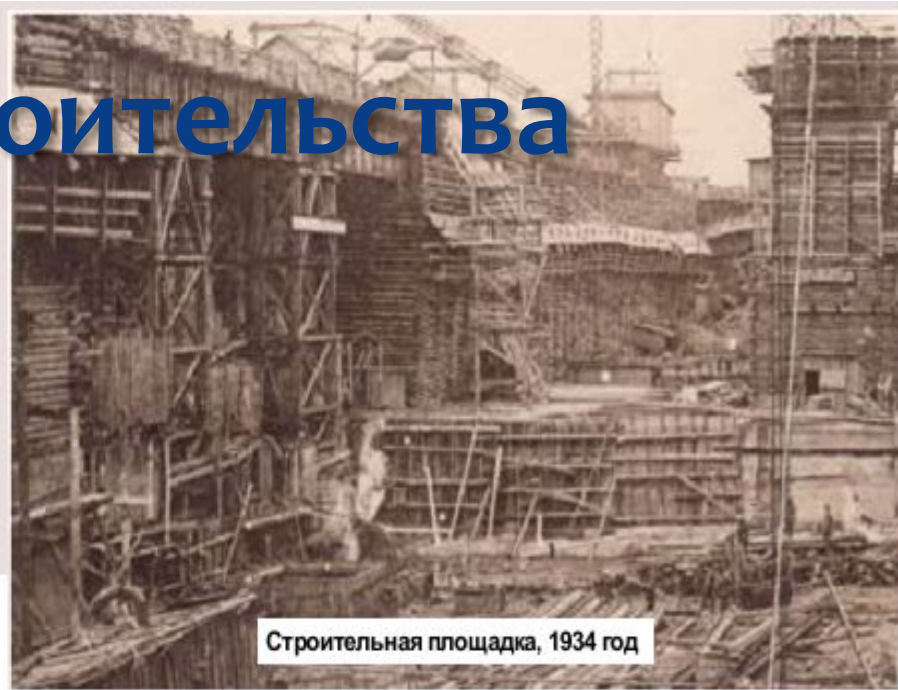
Строительная площадка, 1934 год