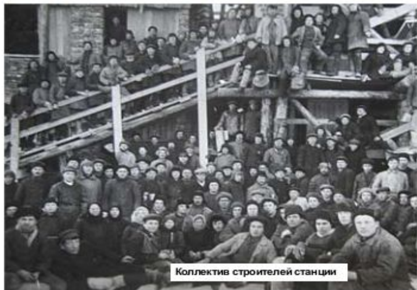
Коллектив строителей станции