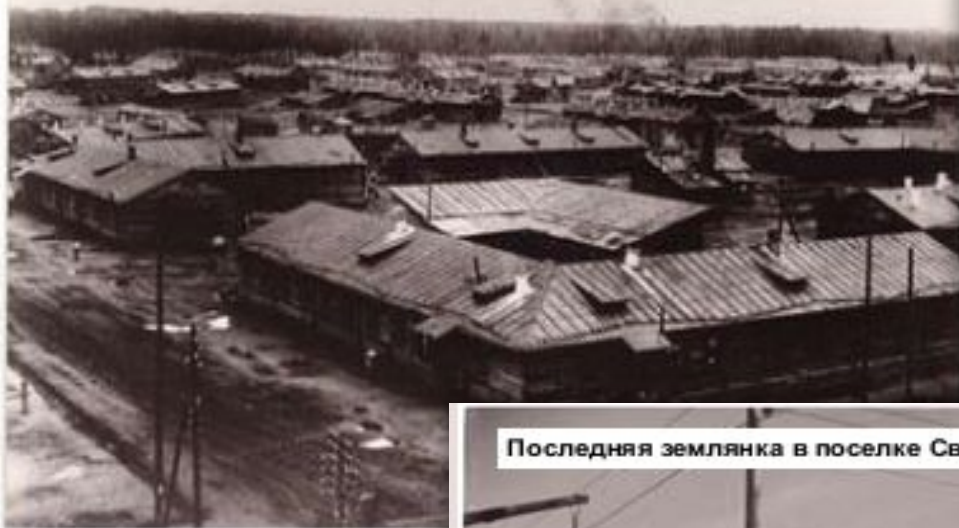
Поселок Свирьстрой, 30-е годы