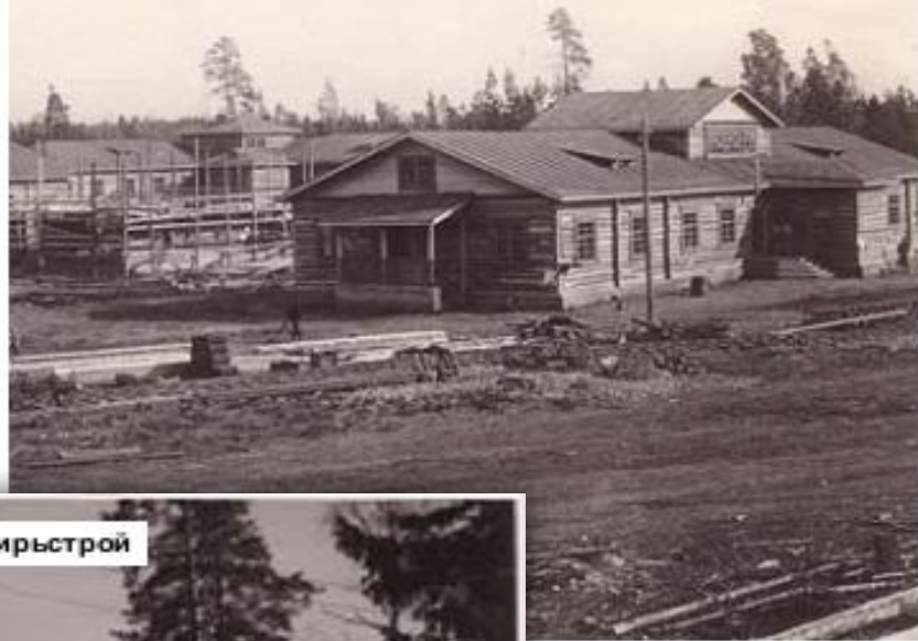
Поселок Свирьстрой, 50-е годы