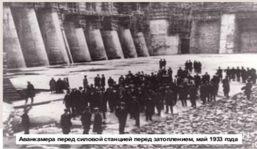
Аванкамера перед силовой станцией перед затоплением, май 1933 года