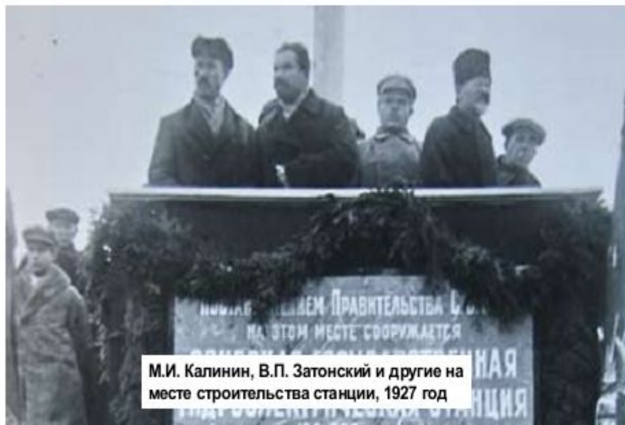
М.И. Калинин, В.П. Затонский и другие на месте строительства станции, 1927 год