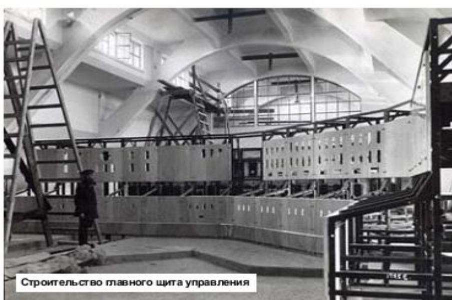
Строительство главного щита управления