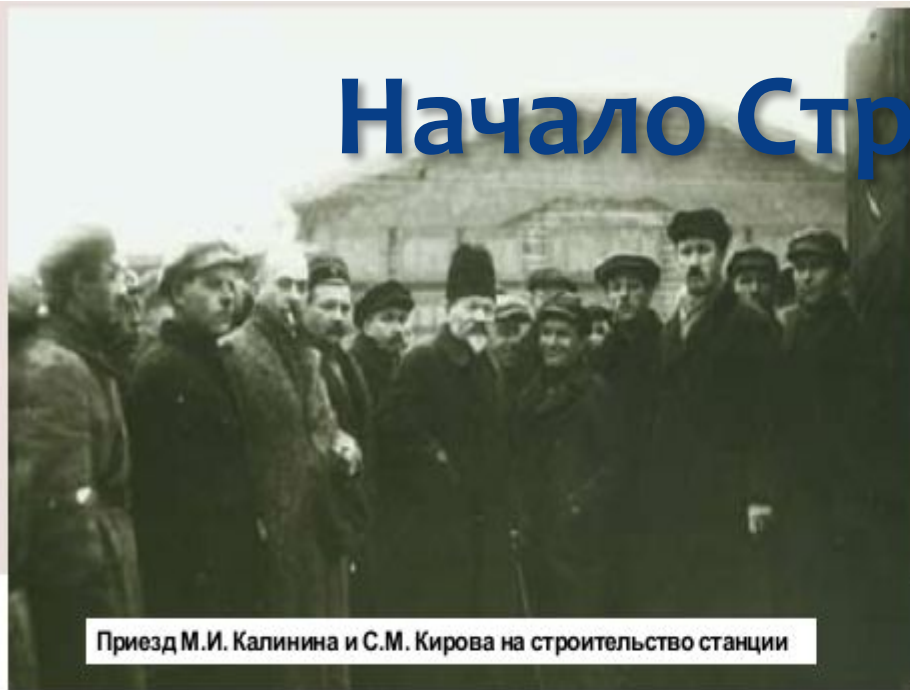
Приезд М.И. Калинина и С.М. Кирова на строительство станции