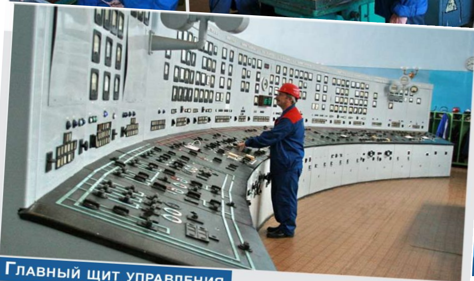
Главный щит управления