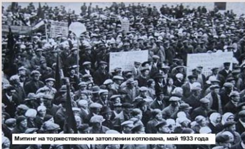
Митинг на торжественном затоплении котлована, май 1933 года