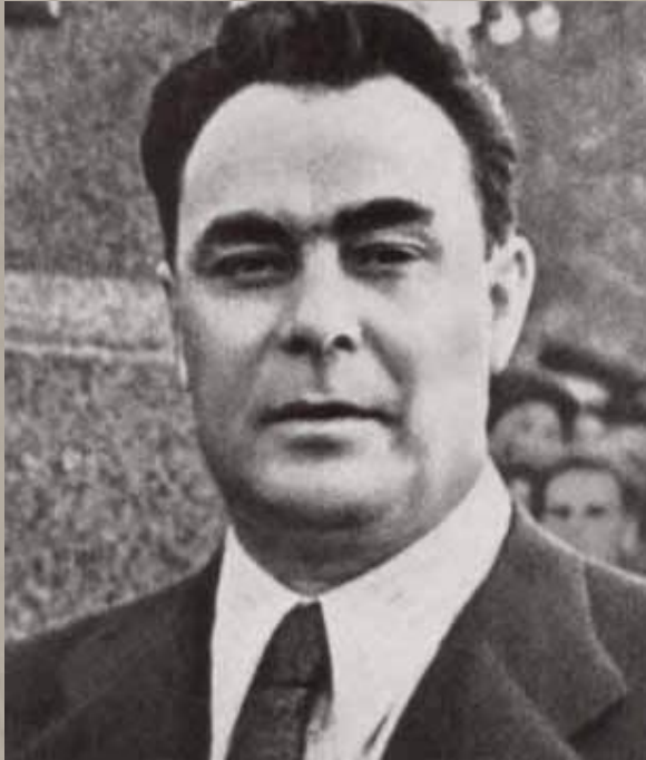
Брежнев Л.И. – Генеральный секретарь ЦК КПСС, с 1977 года Председатель Президиума Верховного Совета СССР