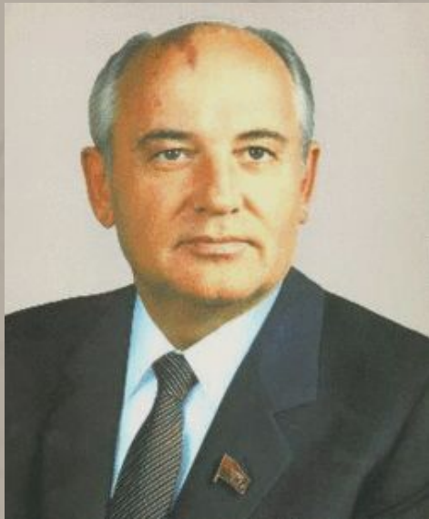
Горбачев М.С. (Ставрополь)