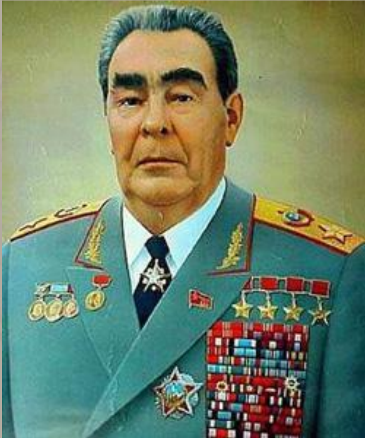
Брежнев Л.И. (1906-1982)