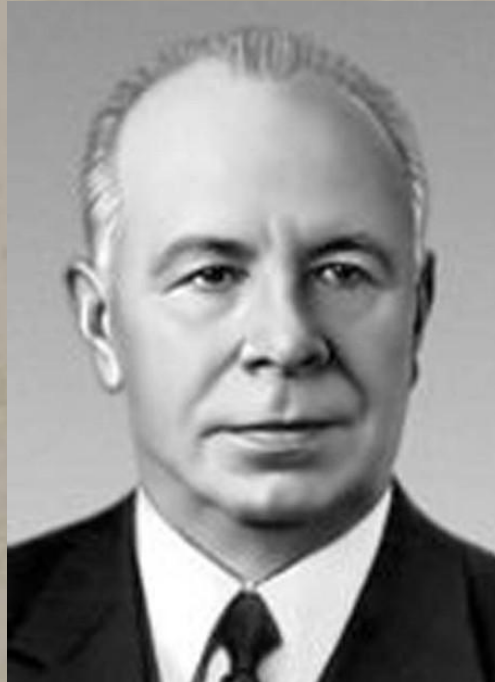
Подгорный Н.В. – Председатель Президиума Верховного Совета СССР