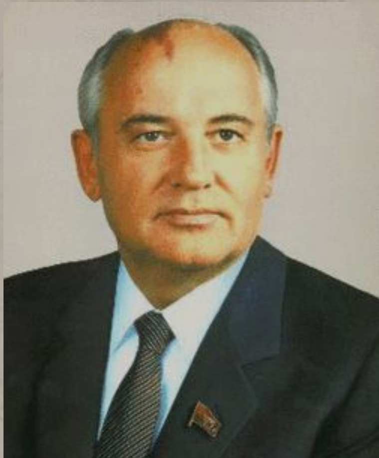
Горбачев М.С. (род. 1931)

Март 1985 года – М.С. Горбачев избран Генеральным секретарем ЦК КПСС