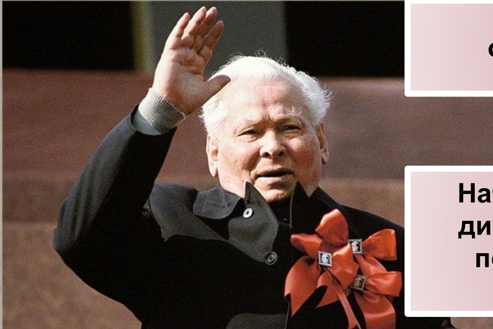
Черненко К.У. (1911-1985)

Обсуждение подлинных общественных проблем было практически свернуто