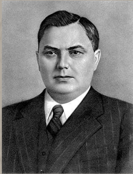
Маленков Г.М. Председатель Совета министров СССР