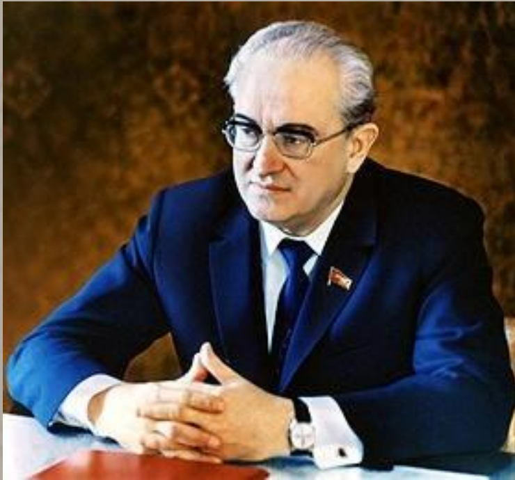
Андропов Ю.В.— С ноября 1982 года Генеральный секретарь ЦК КПСС, С июня 1983 года Председатель Президиума Верховного Совета СССР