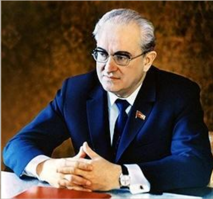
Андропов Ю.В. (1914-1984)