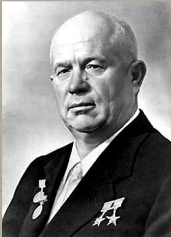
Хрущев Н.С. (1894-1971)

Политика Хрущева не пользовалась поддержкой партийного и государственного аппарата