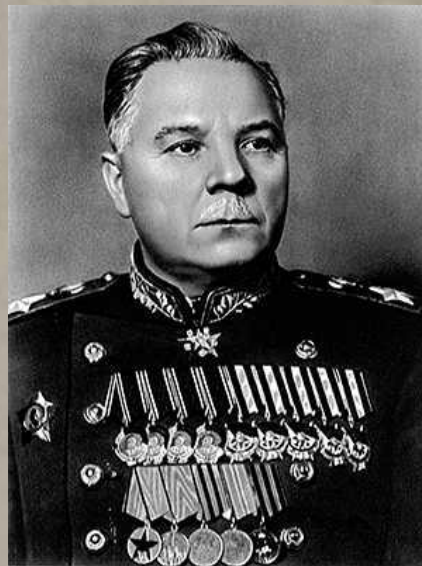
Ворошилов К.Е. Председатель Верховного Совета СССР