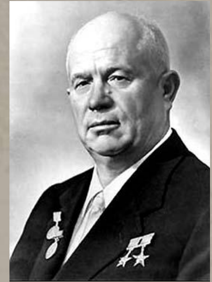
Хрущев Н.С. Секретарь ЦК КПСС, Первый секретарь МГК КПСС