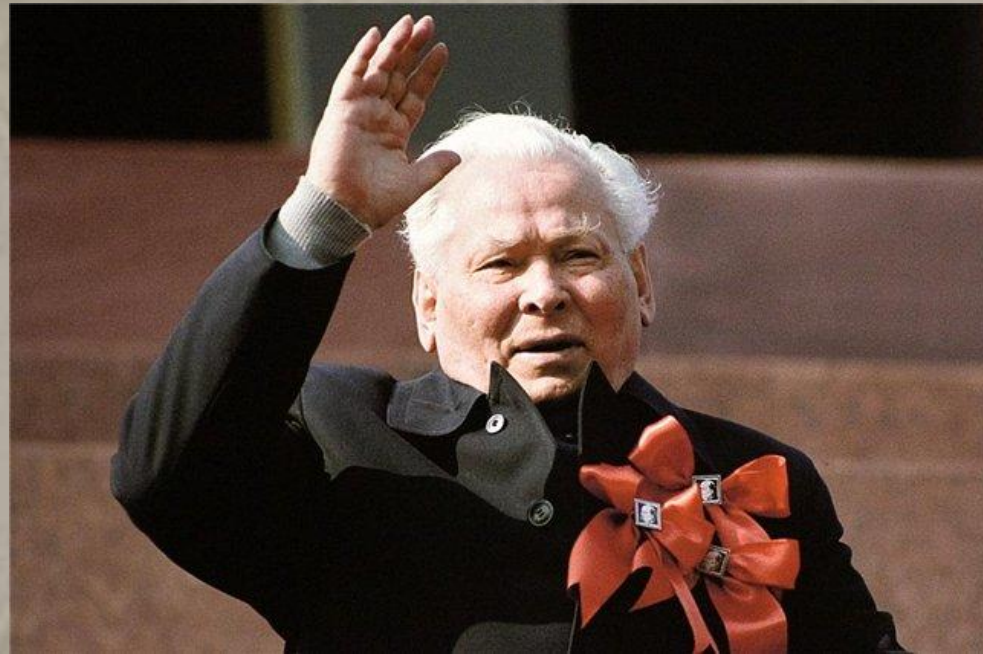
Черненко К.У. – С февраля 1984 года Генеральный секретарь ЦК КПСС, С апреля 1984 года Председатель Президиума Верховного Совета СССР