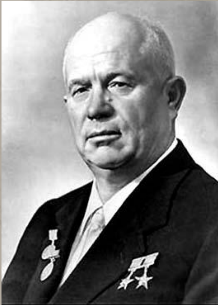
Хрущев Н.С. (1894-1971)

В 1958 году Н.С. Хрущев стал Председателем Совета министров