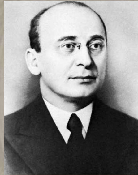
Берия Л.П. Первый заместитель председателя Совета министров, председатель МГБ и МВД