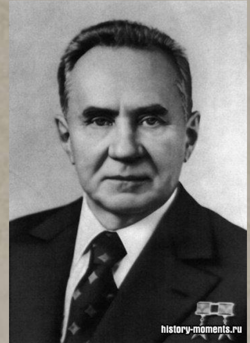
Косыгин А.Н. – Председатель Совета министров