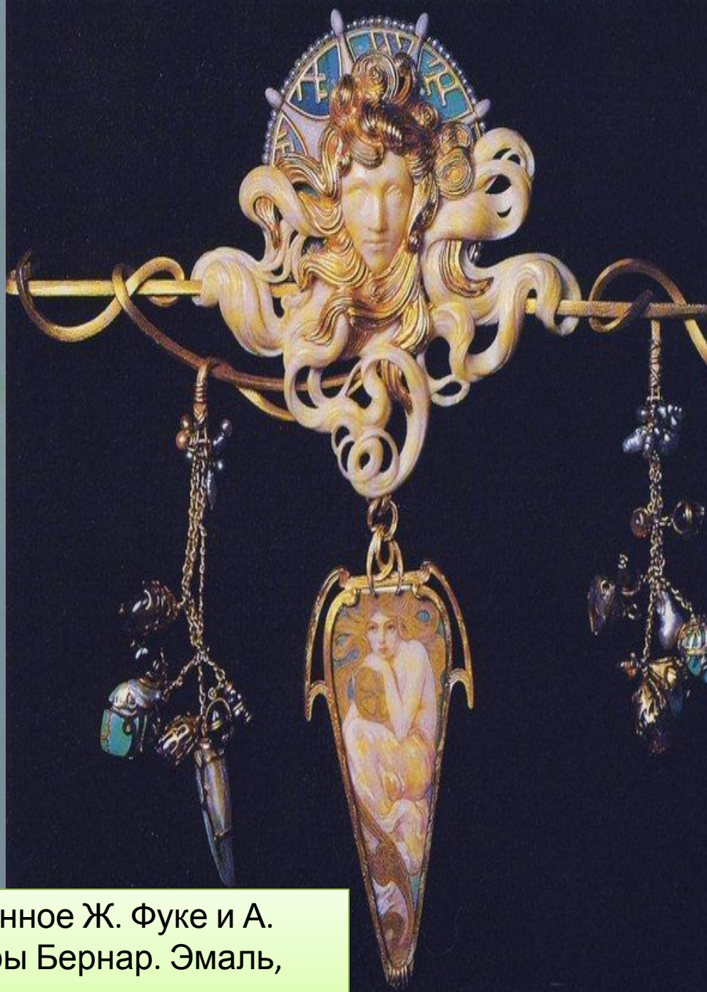
Украшение выполненное Ж. Фуке и А. Мухой по заказу Сары Бернар. Эмаль, кость, бирюза, эмаль.