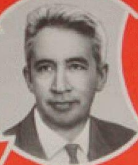
К. И. ЖУКОВСКИЙ