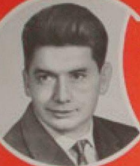
С. П. КОРОЛЁВ