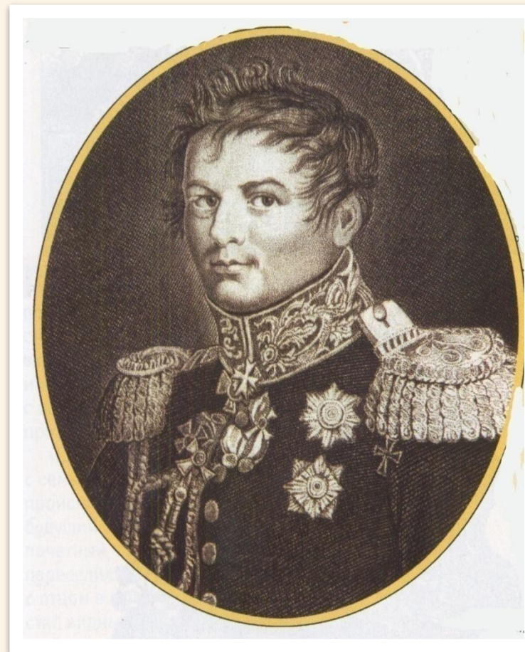
Иван Иванович Дибич-Забалканский