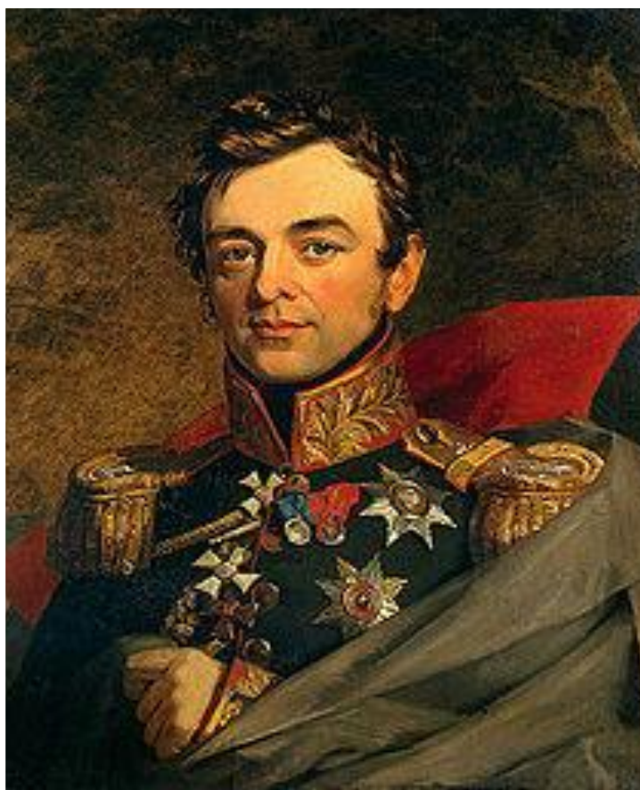
Иван Федорович Паскевич