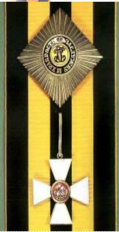
Знак 2-й степени

Императорский Военный орден Святого Великомученика и Победоносца Георгия — высшая военная награда Российской империи.