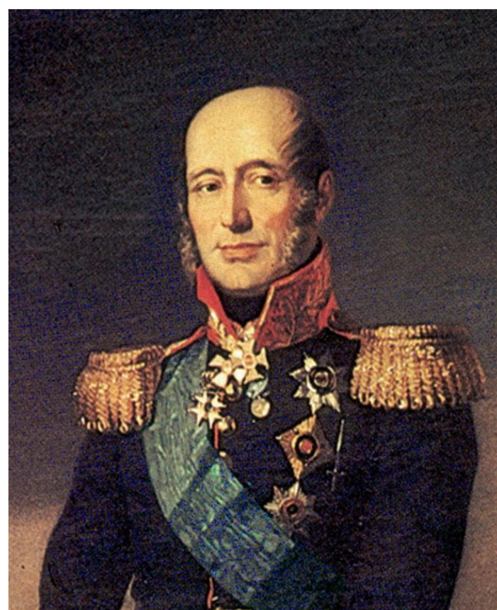
Михаил Богданович Барклай-де-Толли