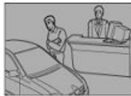
6. Выдача автомобиля