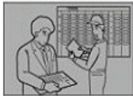
3. Распределение работ