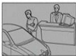
6. Выдача автомобиля