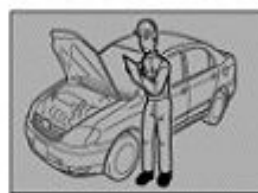
5. Окончательная проверка