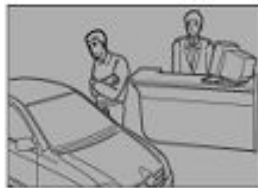
6. Выдача автомобиля