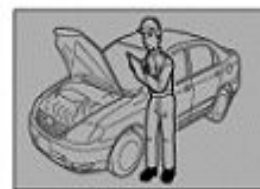
5. Окончательная проверка