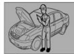
5. Окончательная проверка