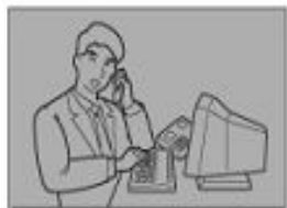
7. Послесервисное сопровождение