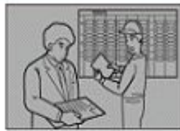
3. Распределение работ