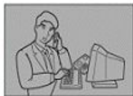
7. Послесервисное сопровождение