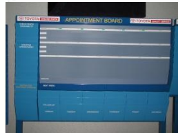
3. Распределение работ