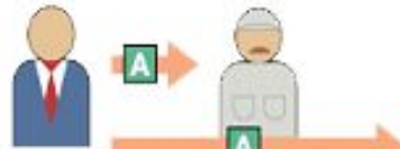
контролер / старший мастер цеха механик