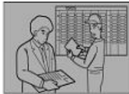
3. Распределение работ