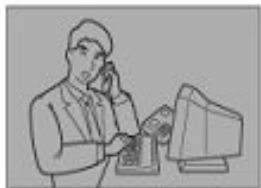
7. Послесервисное сопровождение