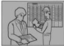
3. Распределение работ