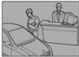
6. Выдача автомобиля