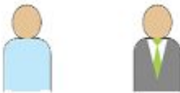
клиент сервисный консультант