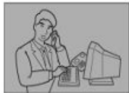
7. Послесервисное сопровождение