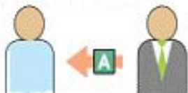
клиент сервисный консультант