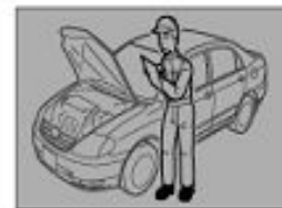
5. Окончательная проверка