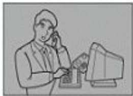
7. Послесервисное сопровождение