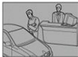
6. Выдача автомобиля