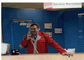
7. Послесервисное сопровождение