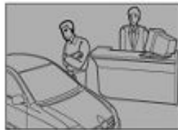
6. Выдача автомобиля