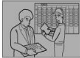
3. Распределение работ